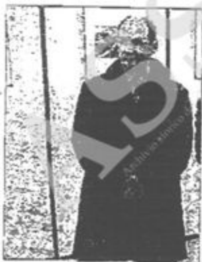
L'assessore provinciale Adami

CAPANNORI - "Abbiamo appreso con piacere la notizia della proroga al 15 luglio dei termini per gli accordi relativi all'estensione della cassa integrazione ai settori lapideo e calzaturiero. Restiamo in attesa di essere convocati a Roma per siglare gli accordi".