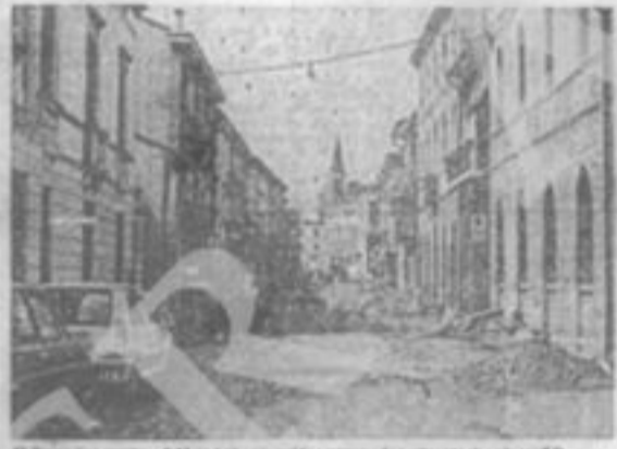
Un'immagine emblematica di Montebello. In basso la piazza per la performance in parafila. In alto, la piazza principale, la più solenne delle polemiche.

questo anno con i compagni comunisti sulla medesima questione. A questo punto, la Giunta comunale è stata così formata.