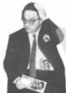
GIANNI DE MICHELIS