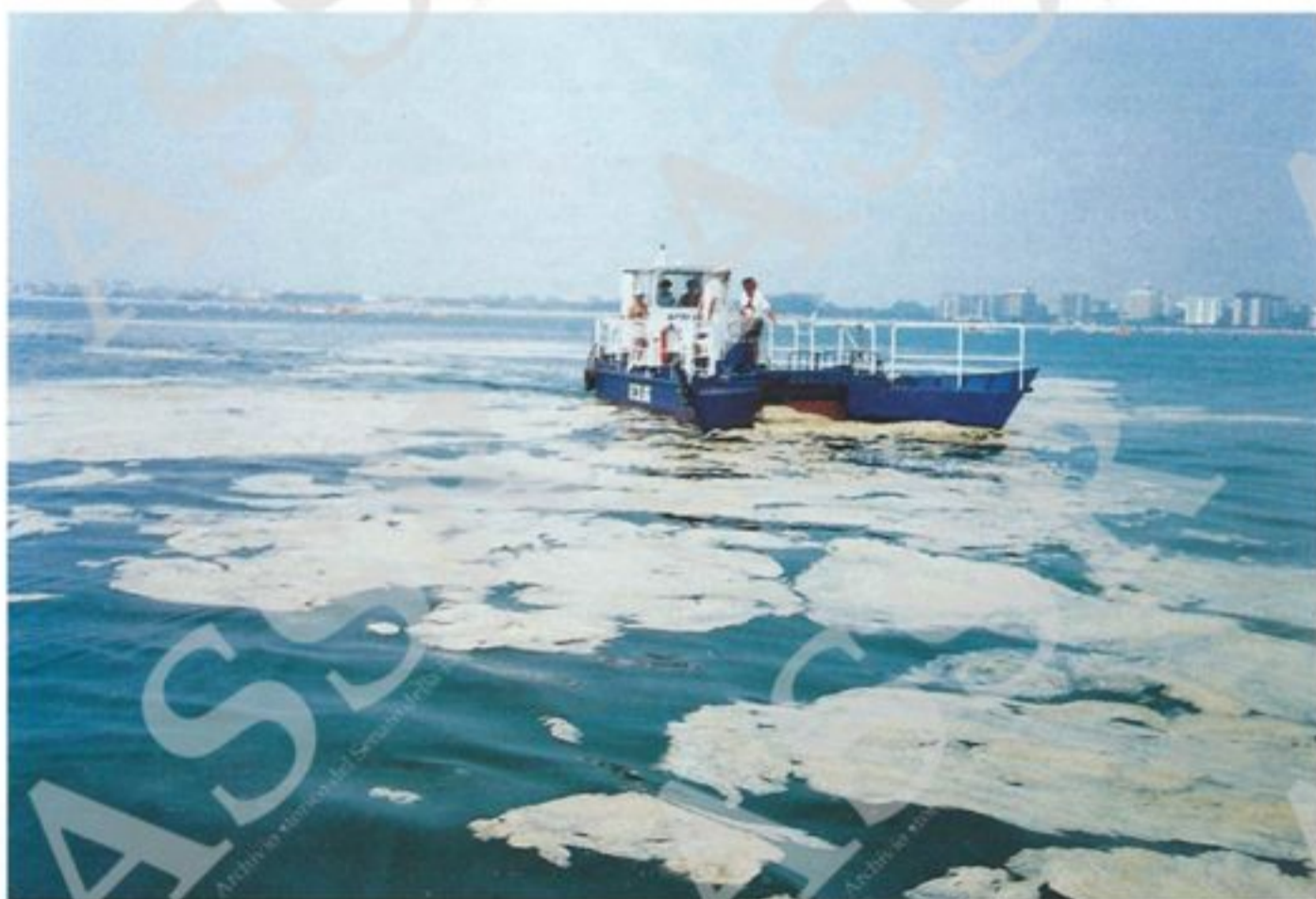
Fase di recupero di mucillagine nel mare Adriatico. Luglio 1989.