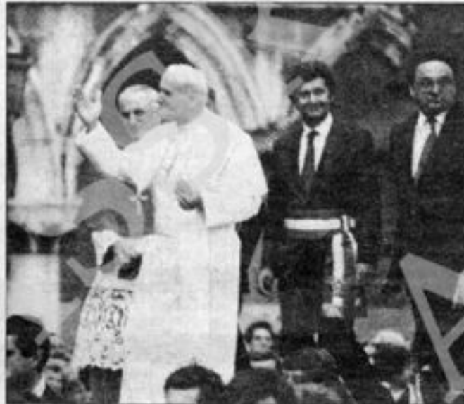
NEL 1985 Rigo con Giovanni Paolo II sul Molo; con loro Cè e De Micheli