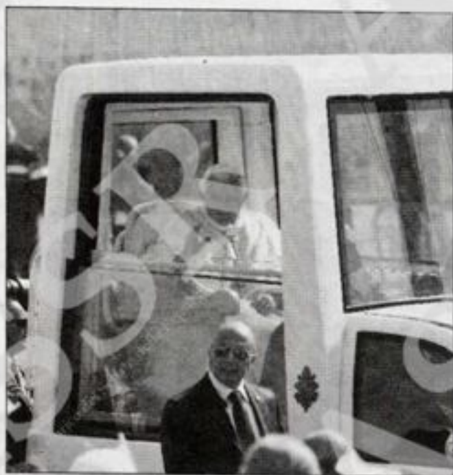
IN MOVIMENTO Il Santo Padre a bordo della papamobile a San Giuliano

L'attenzione alla «Venetia» si spinge fino alla scelta dei canti, tra i quali il seicentesco Regina Coeli del veneziano Antonio Lotti, maestro della fine del baroc-