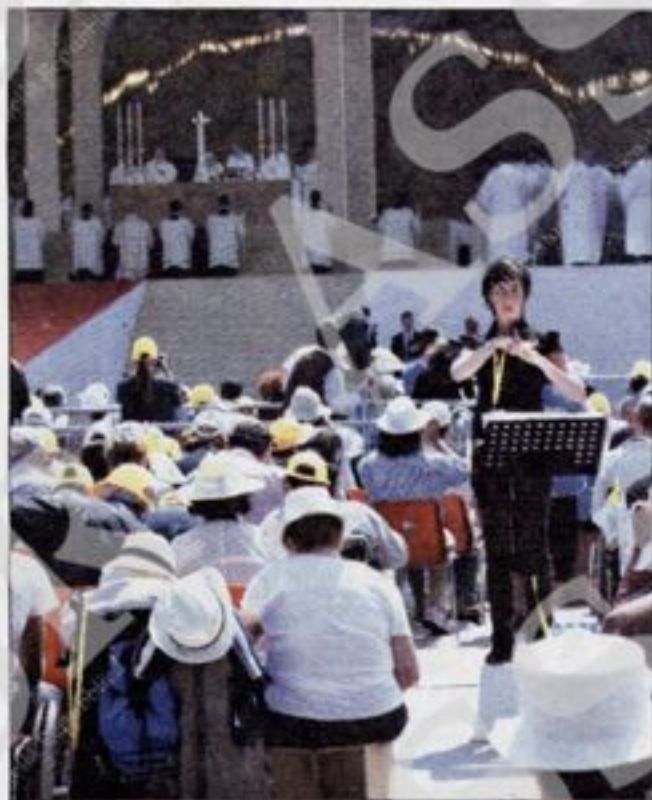
MESSA "TRADOTTA" Sotto il sole il linguaggio dei segni per i non udenti

Alle cinque e mezzo si svuotano le corriere da Slovenia e Croazia