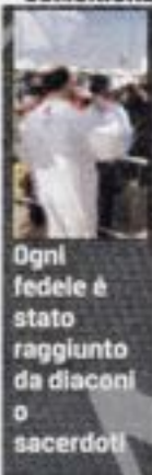
Ogni fedele è stato raggiunto da diaconi o sacerdoti