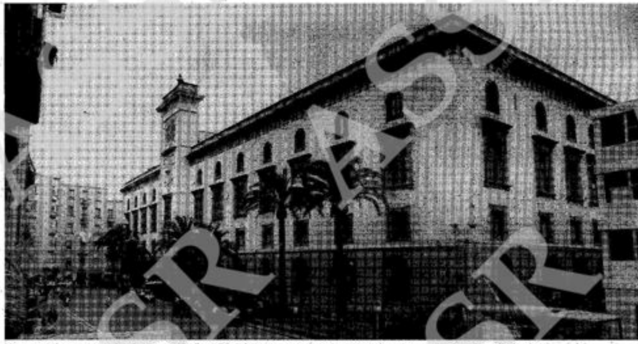
L'ingresso di Castelcapuano, dove hanno sede gli uffici dell'Ordine degli avvocati e dove si tengono le operazioni di scrutinio delle schede elettorali