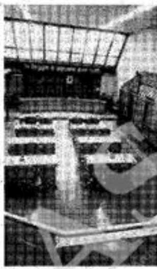
Un'aula del Tribunale penale