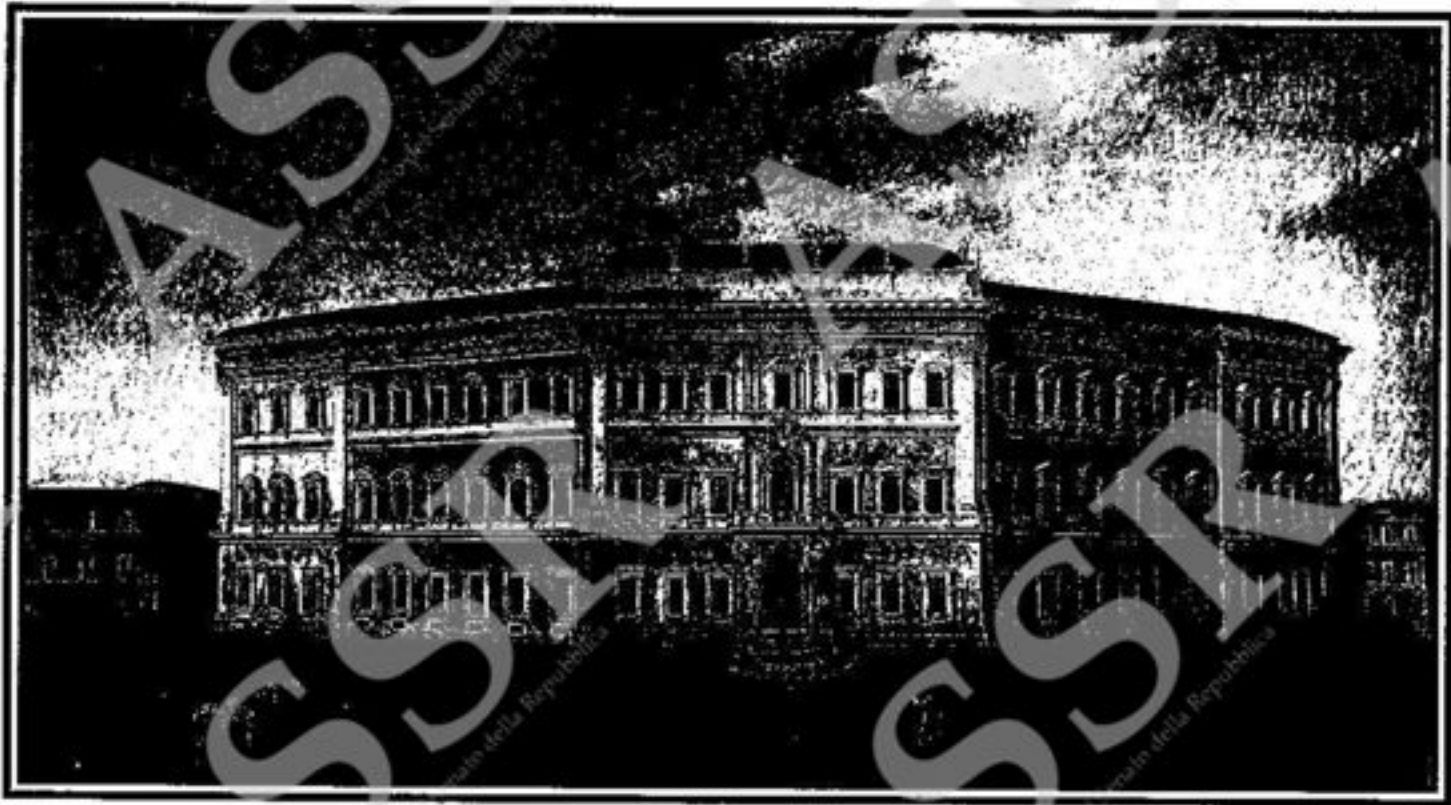
Senato della Repubblica - Archivio Storico