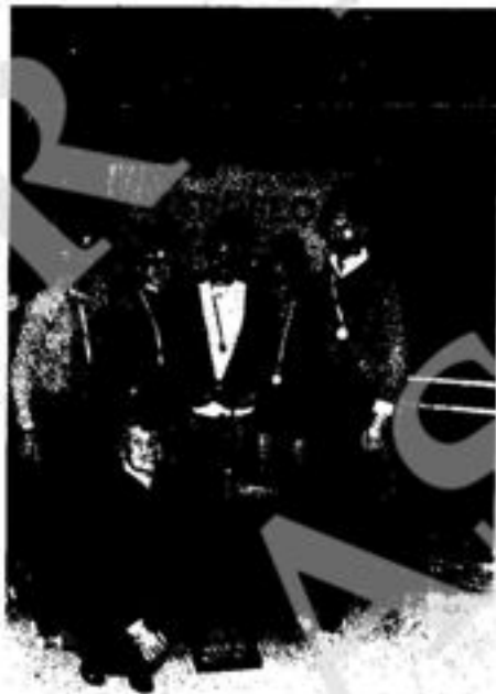
Trofeo « Assi 1976 » - Firenze