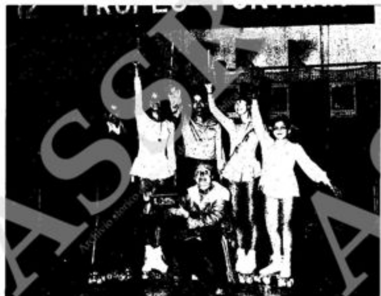
Trofeo « Fontana 1976 » - Bologna