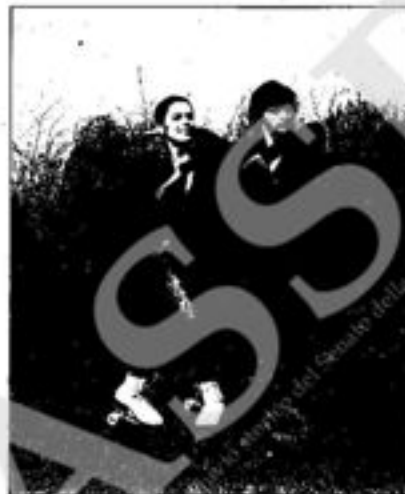
GABRIELE ACHENBACH TORSTEN CARELS Germania Federale

Campionessa del Mondo 1979 - Campionessa d'Europa 1978 - 1979.