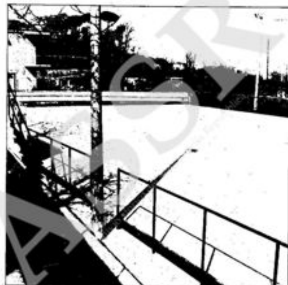
..... e di quella scoperta