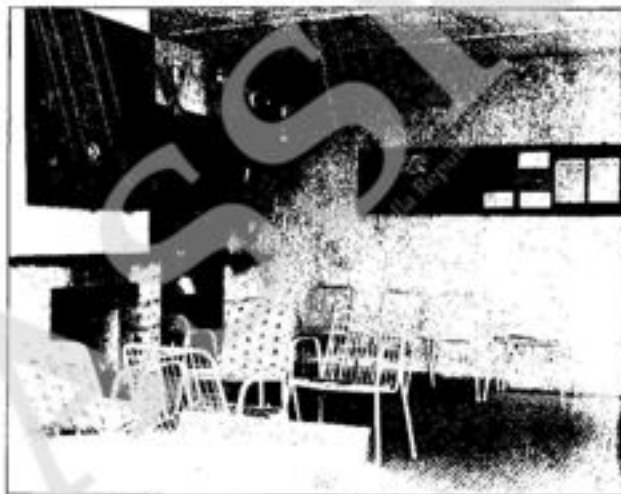
Un angolo dell'accogliente sala di trattenimento