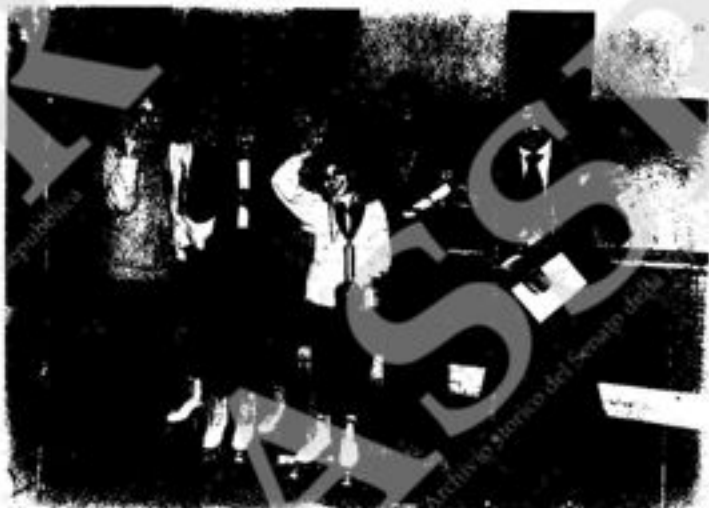
Trofeo « Luigi Rio 1977 » - Modena. Primi ex aequo