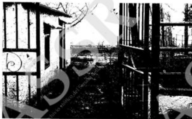
La Segreteria funziona nei giorni feriali dalle 15,30 alle 20 - Tel. 46 88 60