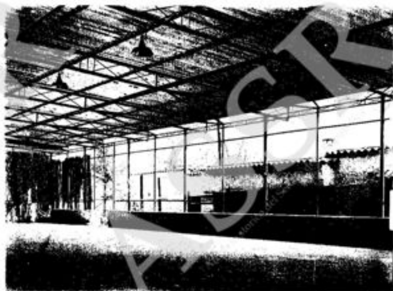
Uno scorcio della pista coperta