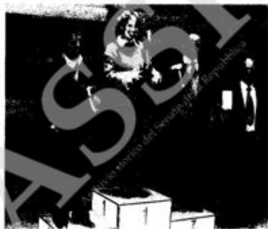
Trofeo « Moretti 1976 » - Mantova