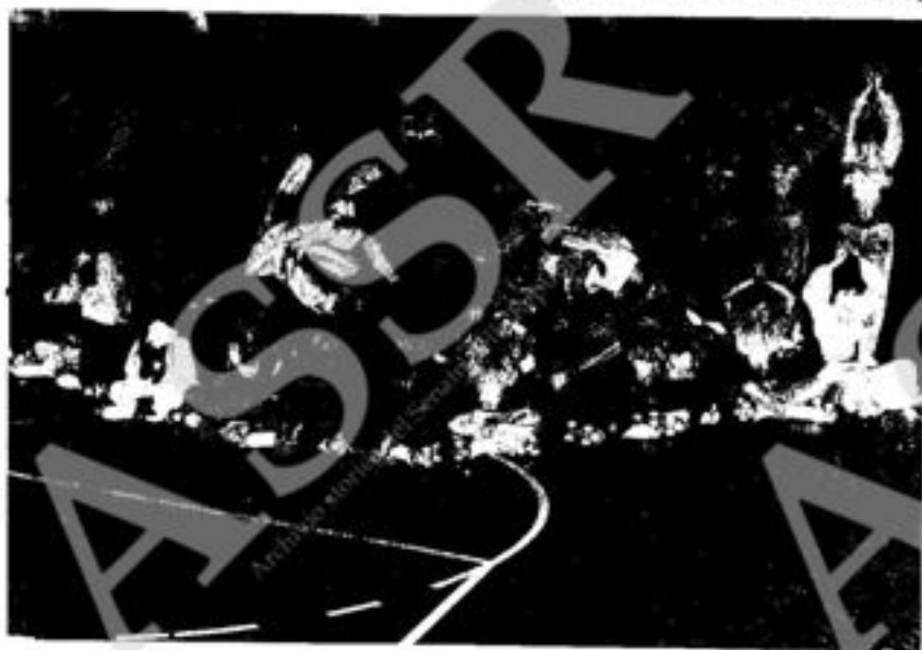
GLI ALLIEVI DELL'A.P.P.A.

Campionessa Provinciale Cat. Juniores Nazionale 1978; 2° classificata ai Campionati Regionali Cat. Juniores Nazionale 1979 (A.P.P.A., Napoli).