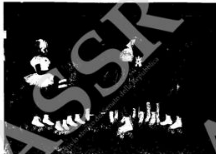
« Biancaneve »