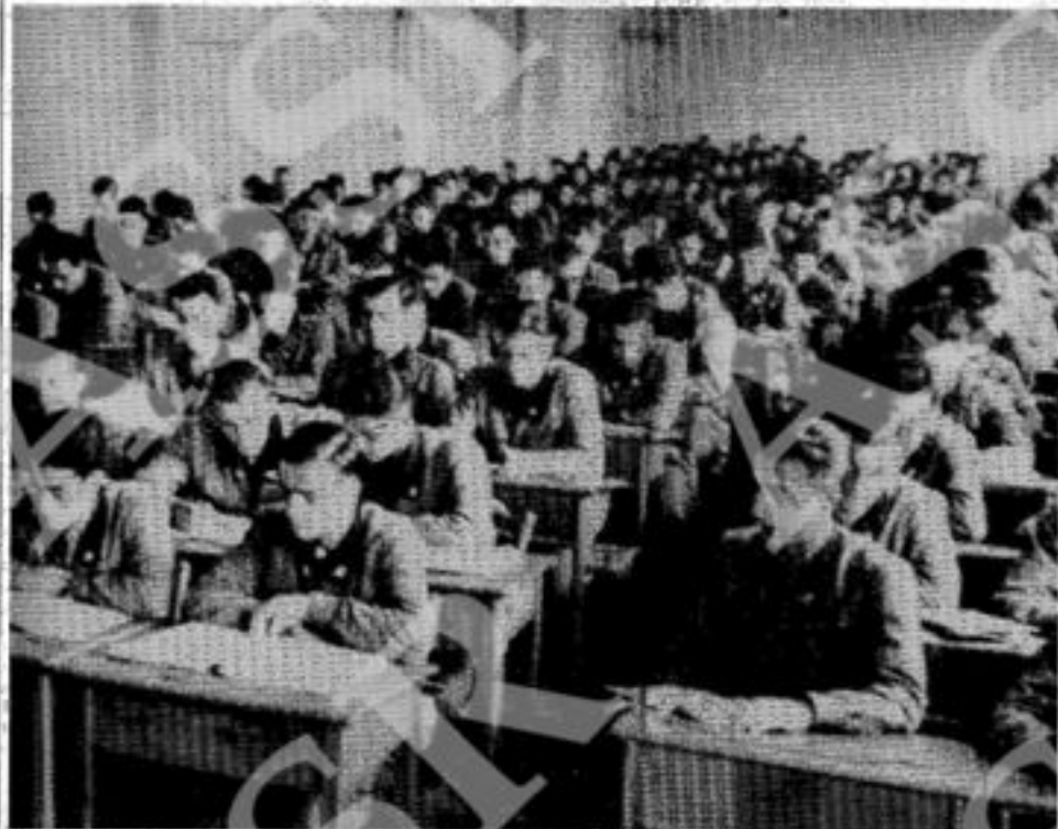
Allievi ufficiali della Repubblica di Salò durante le cose. Nella foto sotto una tavola di Valerio di Guido Crepax