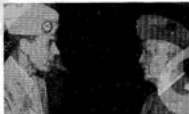
Nella foto qui accanto: Pietro Badoglio con Maxwell Taylor. È il 14 settembre del 1943. Nella foto sotto: la manifestazione popolare a Roma alla caduta del fascismo, il 25 luglio 1943.

Il documento che qui pubblichiamo, da noi ritrovato nell'archivio dell'Internazionale comunista a Mosca, presenta notevole interesse perché permette di fare luce ulteriore sulla dibattitissima questione delle origini della svolta di Salerno. Vi è costruita l'alternativa più completa e organica che si conosca della posizione del Pci all'inizio della primavera del 1944, alla vigilia del ritorno di Togliatti in Italia e dell'instaurata politica che lo vedeva protagonista. Essa contempla l'orientamento strategico di fondo già noto della politica comunista, ma al tempo stesso mette in luce quanto travagliata e piena di oscillazioni sia stata la sua traduzione sul terreno della tattica.