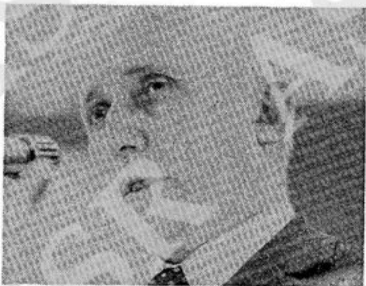
Manlio Rossi Doria

Rinunciò all'incarico di senatore, ma solo per impegnarsi ancora più a fondo nella battaglia per lo sviluppo del Sud. Il professor Manlio Rossi Doria diventò, infatti, presidente dell'«Associazione nazionale per gli interessi del Mezzogiorno». Si tratta dell'associazione fondata da Giustino Fortunato alla quale si deve la ripubblicazione delle biografie e degli scritti dei principali meridionalisti.