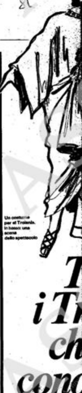
Un costume per il Troiani. In basso: una scena dello spettacolo

Ogni allestimento dei Troiani è una fuga in avanti chiudendo gli occhi per evitare di riconoscere come sarebbero sempre più belli e più giusti — e già pronti — i colonnati e le gradinate, i cieli e i mari, gli alberi e le navi, i costumi di Claude Lorrain, che per una di quelle coincidenze sbalorditive nelle vicende del Genio fornisce i correlativi obiettivi più precisi, prenatali e mirabili, della musica «virgiliana» e romantica di Berlioz. Ogni svincolo dal Sublime, invece, e ogni concessione «Mod» e post-Mod, rischia di porre in dolorosa evidenza — come nel caso della Norma — il ritratto pochissimo benevolo, sotto la grandiosa soavità berlioziana, di taluni comportamenti italiani molto costanti e molto tipici, e molto scadenti, e già presenti con immutabile precisione in quei troiani. In caso di pericolo, abbandonare le donne al massacro e salvarsi con i beni. In caso di bisogno, mandare avanti il bambino a ingrassarsi la signora. Una volta ospitati in un ménage senza capofamiglia, installarsi come in casa propria facendo già i latin lovers prima ancora d'aver messo piede in Lazio. Scoppare la padrona di casa per tenerla buona e ricambiare per il cibo e l'alloggio, sempre facendo pensare che si dà più di quanto non si riceva. Finalmente, svignarsela senza salutare né ringraziare quando altre