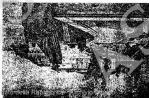
Scultura della Repubblica di Napoli