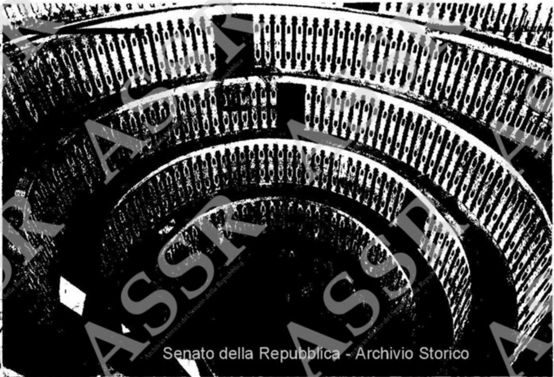
Senato della Repubblica - Archivio Storico