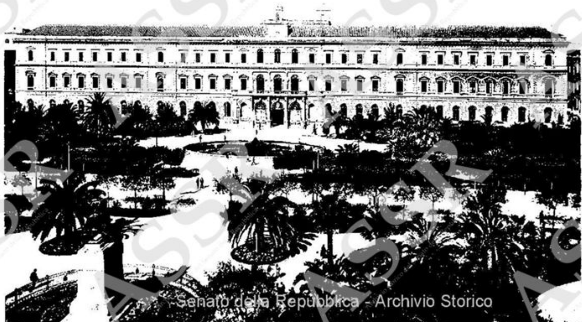
Senato della Repubblica - Archivio Storico