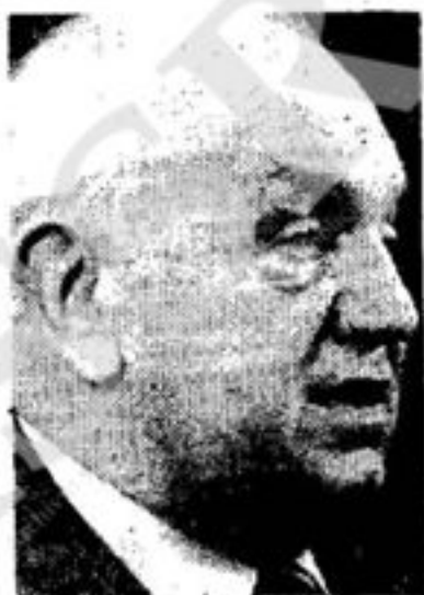
Francesco De Martino

— Onorevole De Martino, il partito socialista è di nuovo a un passaggio difficile, quello che si riunirà nei prossimi giorni viene da qualcuno definito un comitato centrale «storico». Si afferma che «vale un congresso». In ogni caso il volto del partito, o almeno del suo vertice, potrebbe risulterne di nuovo mutato.