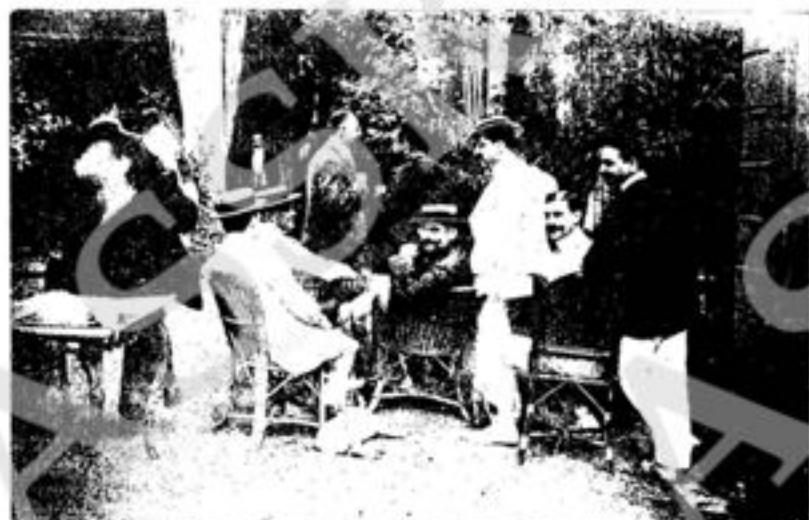
Roberto Bracco durante un soggiorno all'Hotel Tramontano di Sorrento