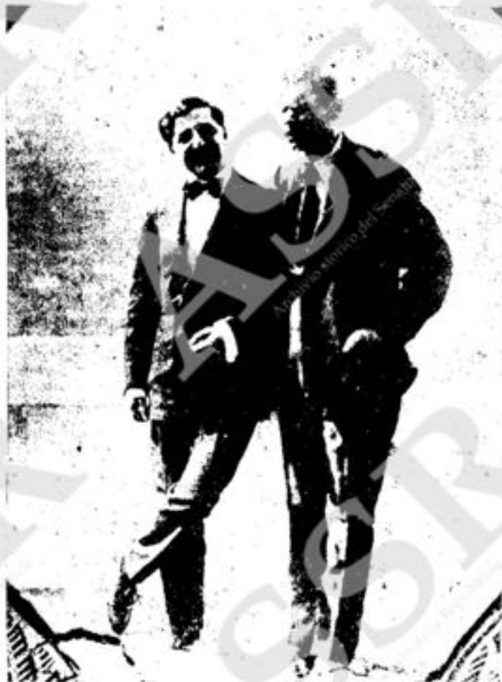
Roberto Bracco e Massimo Gorkij a Capri.

una "commedia boccaccesca", così definita dallo stesso autore, in 3 atti, Il frutto acerbo (1904), e seguito dall'atto unico drammatico Notte di neve (1906) che Bracco volse poi in dialetto napoletano col titolo Nuttat' e neve . Per rappresentare la sua Napoli, Bracco non aveva bisogno di ricorrere al dialetto e direttamente in vernacolo, non scrisse che un atto unico, L'ucchie cunzaccate , che poi riscrisse in italiano. Mentre metteva la gloria di questi successi, nel 1906 ridusse a libretto il suo dramma Sperduti nel buio . La passione per la musica lo portò anche a scrivere lo scenario della Favola del Vecchione, della Vergine e del Pazzo , opera lirica in 3 atti, destinata alle musiche di Giacomo Puccini.