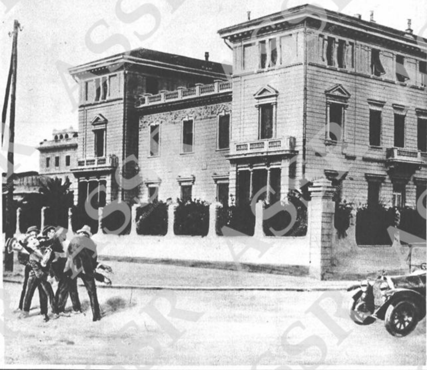
L'impressionante scena dell'agguato teso al deputato socialista Matteotti, barbaramente assassinato, dopo la violenta cattura, in seguito a complotto (Ricostruzione con documenti fotografici, di A. DELLA VALLE)

Anno I. N. 20 NAPOLI - 23-30 Giugno 1924 Prezzo: Cent. 30