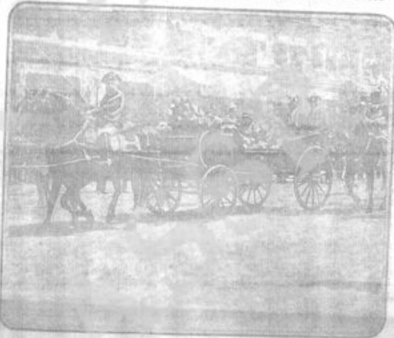
A Madrid — La berlina con le due Regine ed il Principe di Piemonte passa per la Calle de Alcalá.