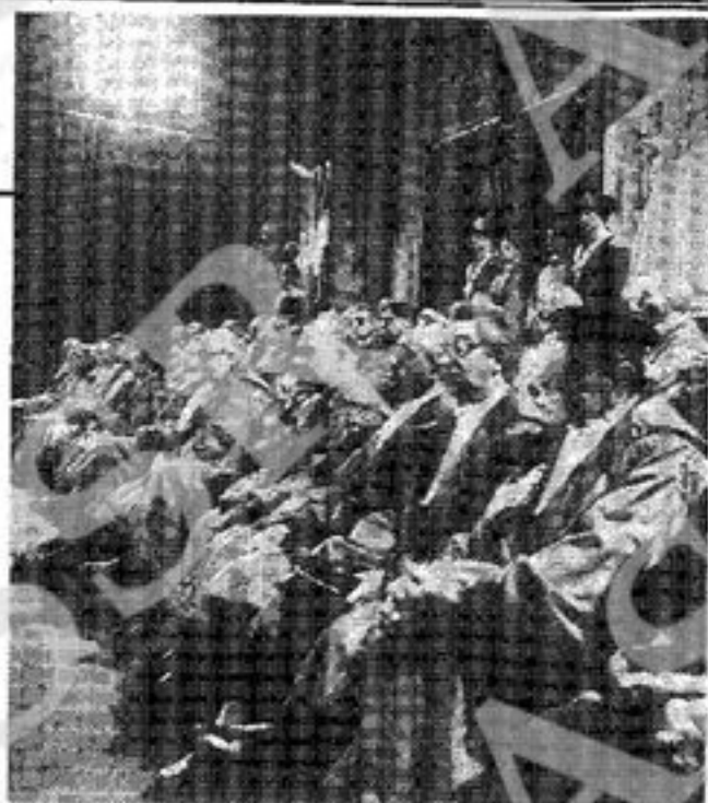
La Corte d'Appello (a sin.) e l'inaugurazione dell'anno giudiziario '90