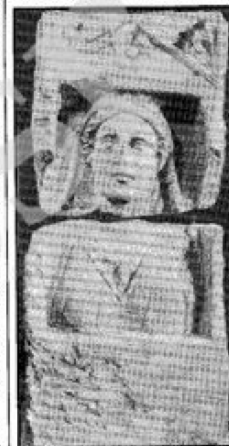
Stele di una donna illirica

creati sul vasto territorio illirico, lo Stato Illirico o meglio il Regno Illirico raggiunse il più alto grado di sviluppo politico ed ebbe un ruolo importante negli avvenimenti politici del tempo. A partire dalla nascita di questo Stato, le parole Illirico e Illiria assunsero, oltre al loro senso lato etnico e geografico, un altro senso più stretto, politico, in relazione ai fatti storici che ne avevano segnato la formazione e a questa parte degli Illirici che, nelle fonti scritte, saranno designati con l'appellativo di "Illiri propriamente detti".