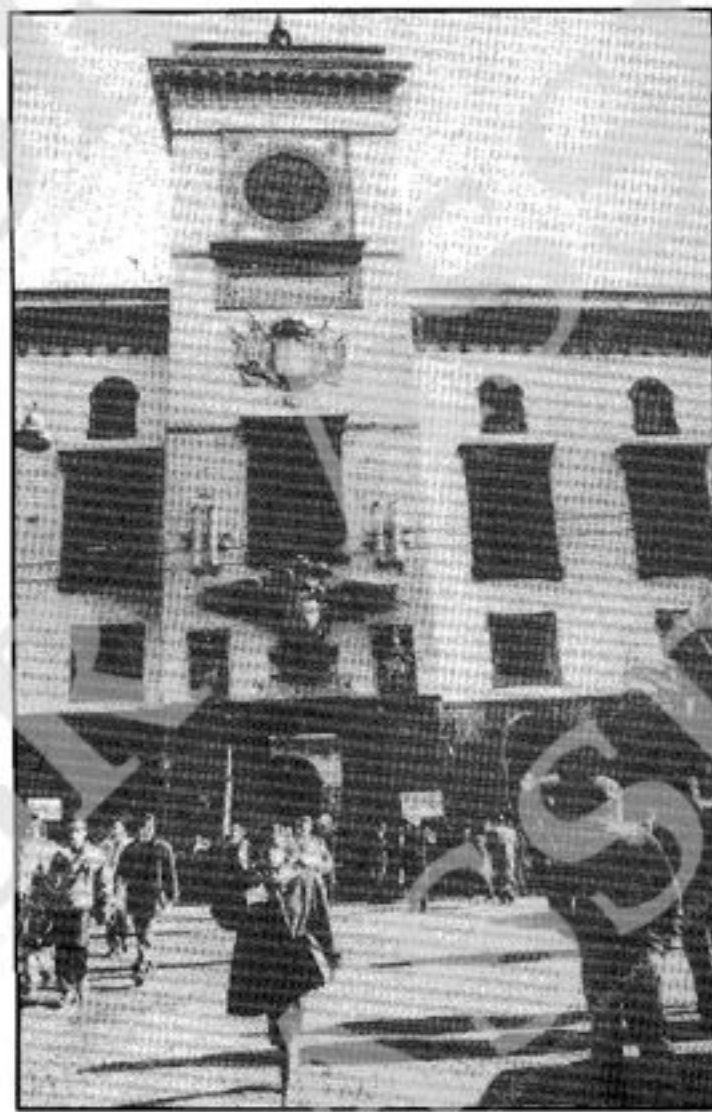
Il tribunale di Napoli

L'unità indispensabile per evitare che una sconfitta politica si trasformi in una sconfitta storica dovrà essere tenacemente perseguita nell'azione, nella vigorosa opposizione al governo che renda evidente il carattere alternativo della sinistra nella sua autentica ragion d'essere, non massimalista, ma nemmeno rinunciataria nell'inseguire l'illusione di un generico democra-