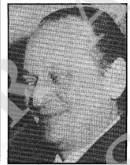
Il ministro Gioia

«Di fatto non avrei potuto reggere a lungo.