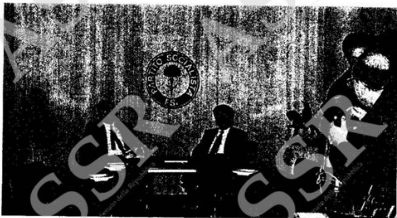
Un incontro tra Bettino Craxi e Achille Occhetto nella sede del partito socialista. Nella pagina accanto: Norberto Bobbio