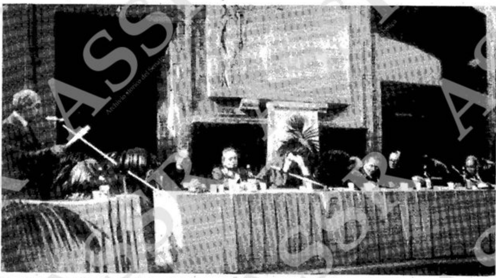
La presidenza del Convegno sulla Giustizia organizzato dagli Avvocati ieri nel salone del Busti a Castelcapuano

Significative le assenze politiche - L'intervento del senatore Ricci (Pci) e la lettera di De Martino: «Imporre le riforme»