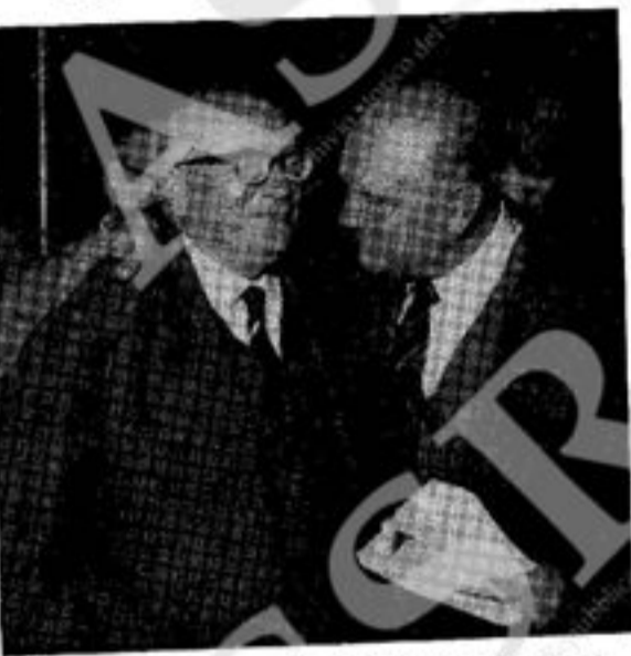
Il compagno Francesco De Martino con Pietro Nenni

Ero ritornato a casa dopo l'esperienza della Resistenza, e non tardai ad accorgermi che nel sud in Resistenza, la formazione di un movimento democratico ed antifascista, di massa, cominciava allora. Ti ricordo — eri ancora nel Partito d'azione — nel corso di quella battaglia. Sapevi che al tuo partito non sarebbe arreso il successo, ma conosciesti la tua campagna per la repubblica con un impegno massacrante: qualche volta l'automobile, ma spesso i trenini, la bici-