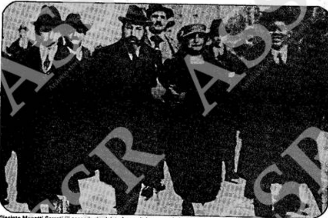
Giacinto Menotti Serrati (il secondo da sinistra) con altri congressisti a Livorno