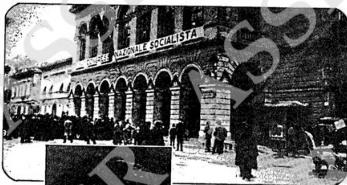
Il teatro Goldoni di Livorno nei giorni del diciassettesimo congresso del partito socialista