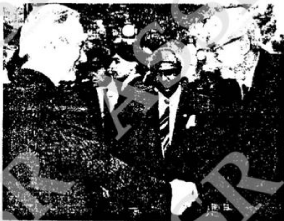
Il presidente dell'IFAD accoglie il Capo dello Stato