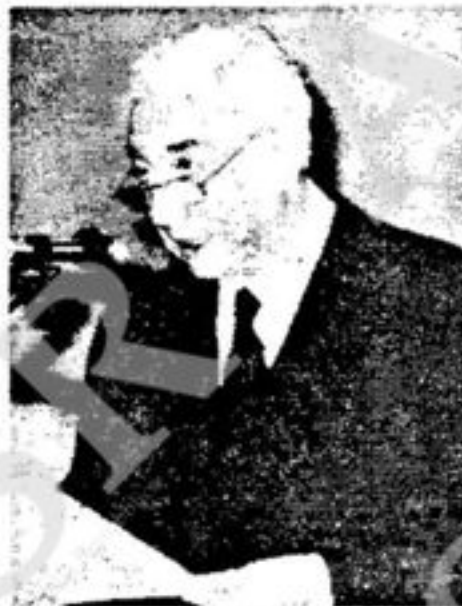
Cossiga durante l'intervento all'IFAD

«Deve cessare lo scandalo intollerabile di milioni di uomini, donne, bambini e anziani in quotidiana drammatica ricerca del minimo indispensabile alla sopravvivenza», ha esortato Cossiga nel suo intervento. Il presidente italiano ha denunciato la corsa agli armamenti «che ingenera