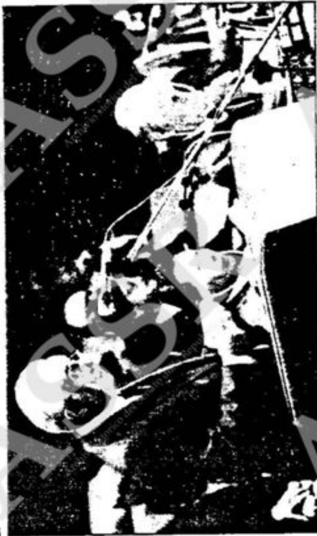
Il presidente Cossiga nel corso del suo intervento all'assemblea dell'IFAD a Roma

Cossiga ha ribadito poi la sincera e costruttiva disponibilità dell'Italia nella lotta alla fame nel mondo e a sostegno dell'azione multilaterale, dal momento — ha