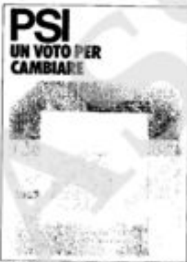
32 pagine, formato 17 x 12. Tiratura 400.000 copie