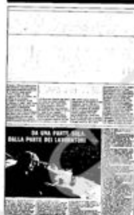
8 pagine, a due colori, formato 44 x 25. Tiratura 500.000 copie