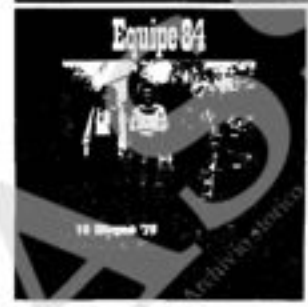
In alto: un disco della Equipe 84. 200.000 copie.