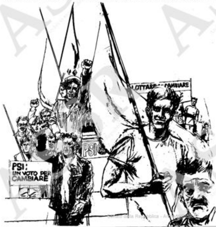
Disegno della Repubblica - A. ...