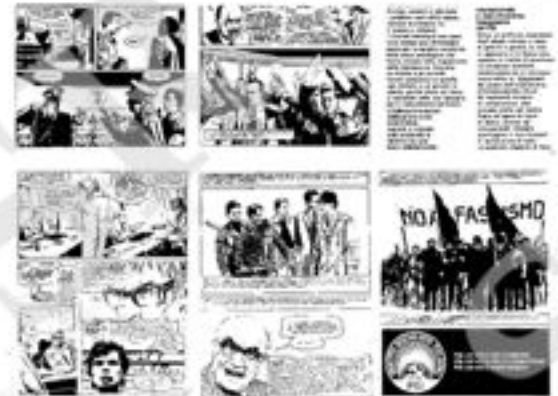
Formato 30 x 22. 48 pagine. Tiratura 300.000 copie