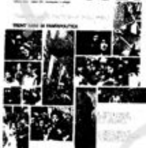
Notocalco, 32 pagine, formato 30 x 32. Tiratura 500.000 copie