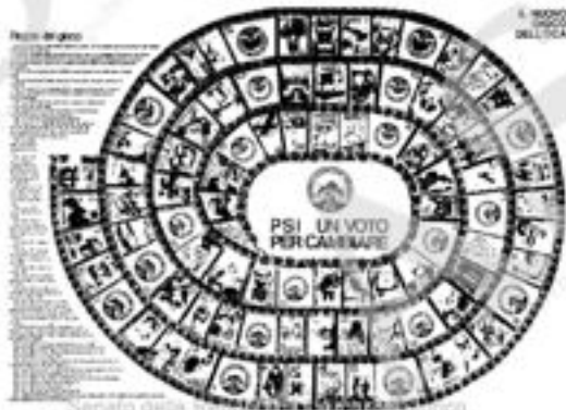
A destra: il nuovo gioco dell'oca. Tiratura 200.000 copie.