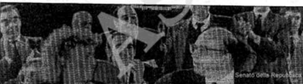
Senato della Repubblica