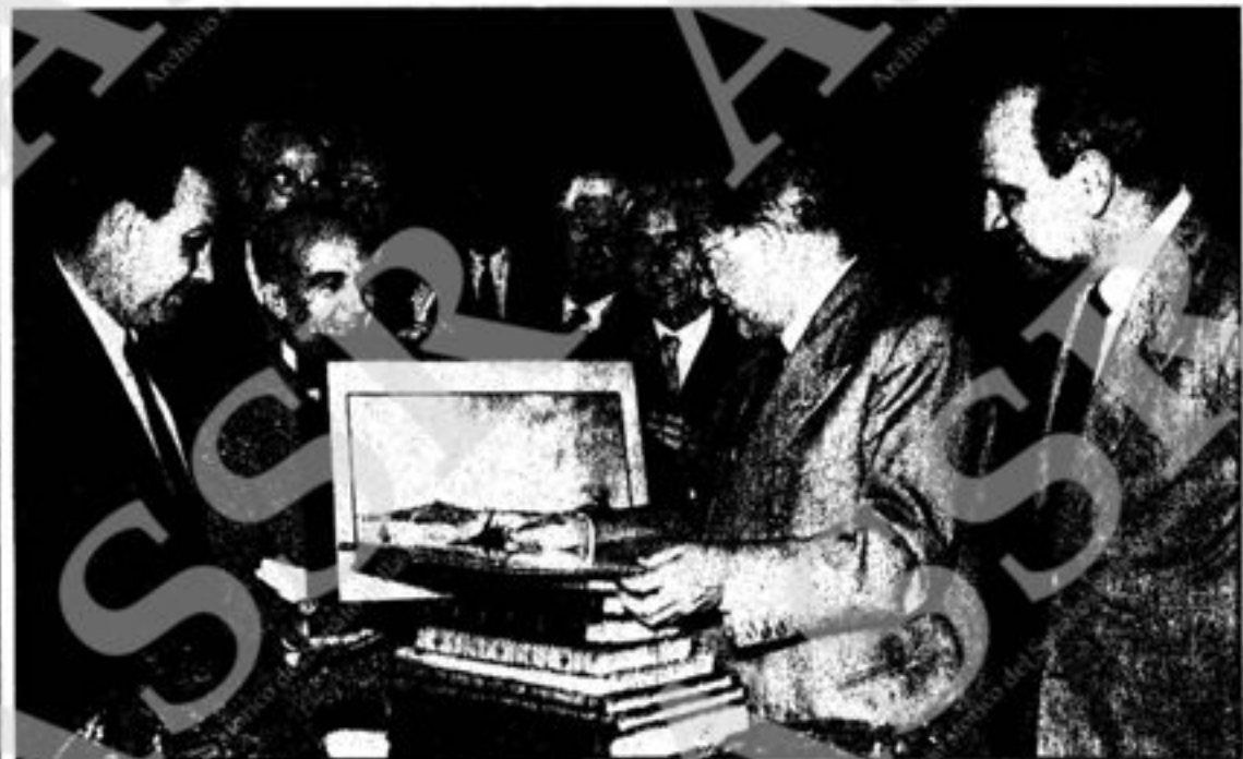
Togliatti, nel corso di una manifestazione al teatro Mercadante, a Napoli, riceve doni da parte di una delegazione operaia. Accanto a lui sono, da una parte, Arnaldo Labriola, lontanissimo riformista che fu capofila del PCI nelle elezioni comunali del 1956 e dall'altra, a destra, Francesco De Martino.

Nell'ora di supremo isolamento di Yalta, scrisse poche pagine per dire che l'unità andava ricercata, con pazienza e nel concreto, senza coesione né comunicazioni, con un'azione comune dall'Atlantico al Pacifico per comprendere le campagne cinesi. Utopia o realismo che fosse, non è la stessa cosa di quanto, l'altro giorno ha scritto la Pravda a proposito di un Togliatti « sempre contrario allo scissionismo cinese ». In un modo o nell'altro il personaggio sfugge ad interpretazioni scottate o parziali. Benvenuti i libri, i dibattiti, i contrasti che ripercorrono la storia, non allungando l'agiografia, ci aiutano a fare più luce sull'oggi.