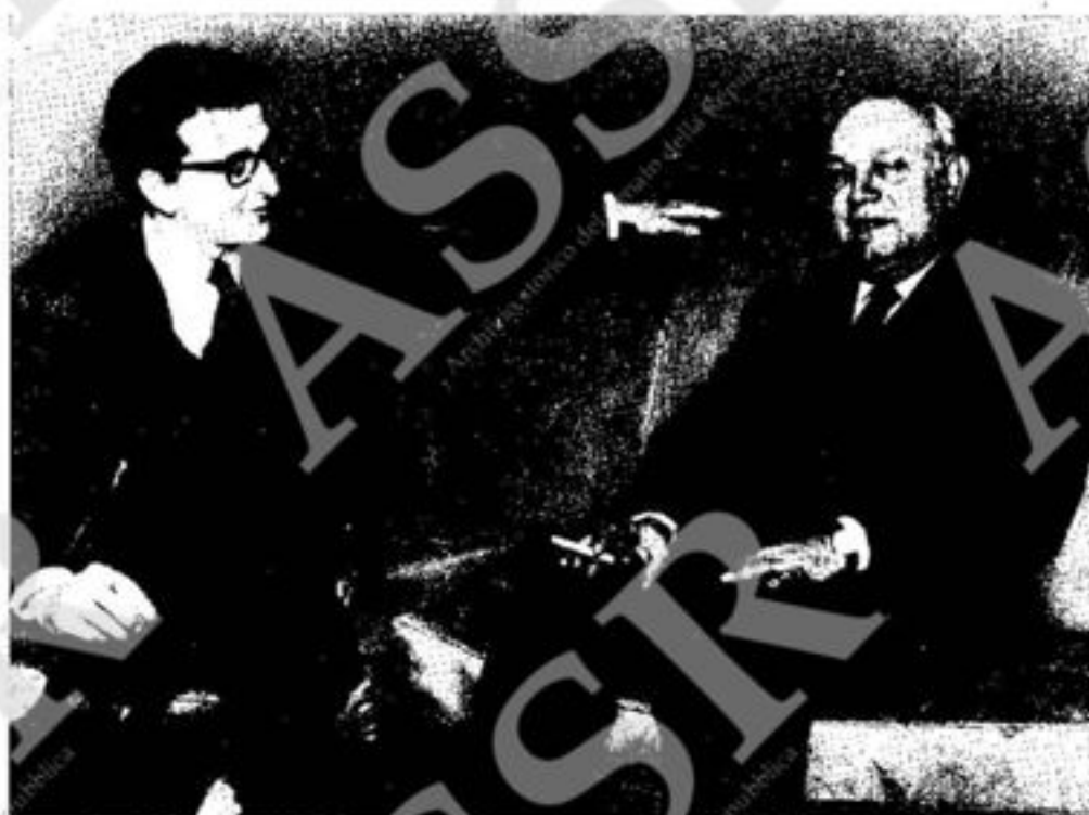
Andrea Barbato e Francesco De Martino

Il compagno Francesco De Martino ha rilasciato ad Andrea Barbato la seguente intervista comparsa sul quindicinale "L'altra Italia"