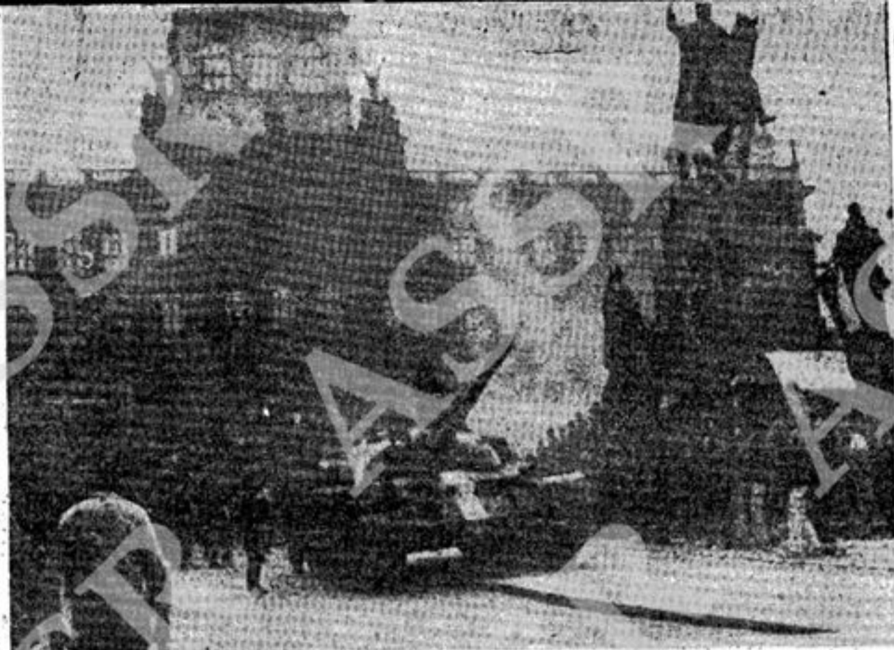
PRAGA — Il primo carro armato sovietico è giunto nella famosa piazza S. Venceslao. La folla lo circonda.

NOTIZIE CONTRADDITTORIE DALLA CAPITALE SOVIETICA