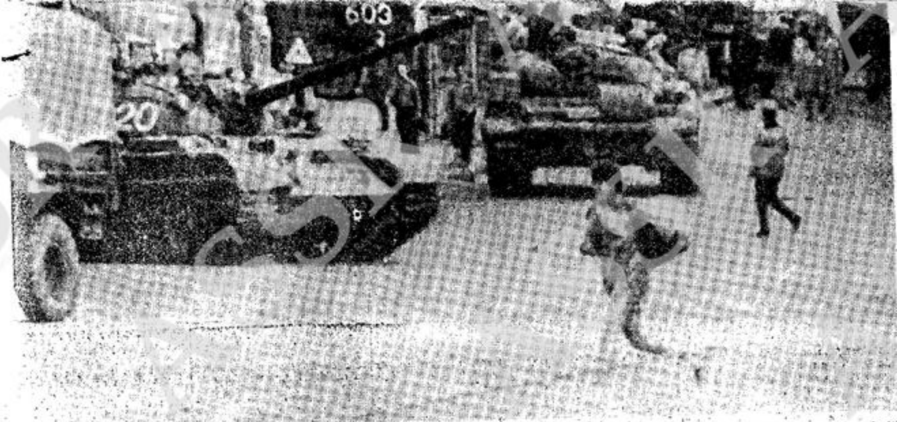
BRATISLAVA — Una ragazza cecoslovacca attraversa correndo una strada cittadina mentre i carri armati sovietici stanno sopraggiungendo a forte velocità

Dopo aver ascoltato una relazione del segretario Longo