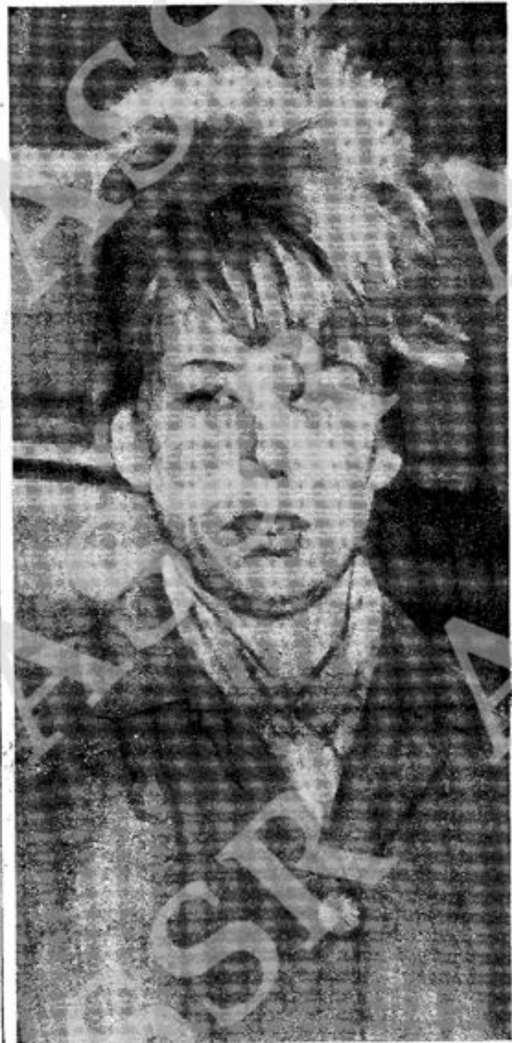
Mrs. Cove—Her baby was in ward-of-court proceedings on Wednesday.