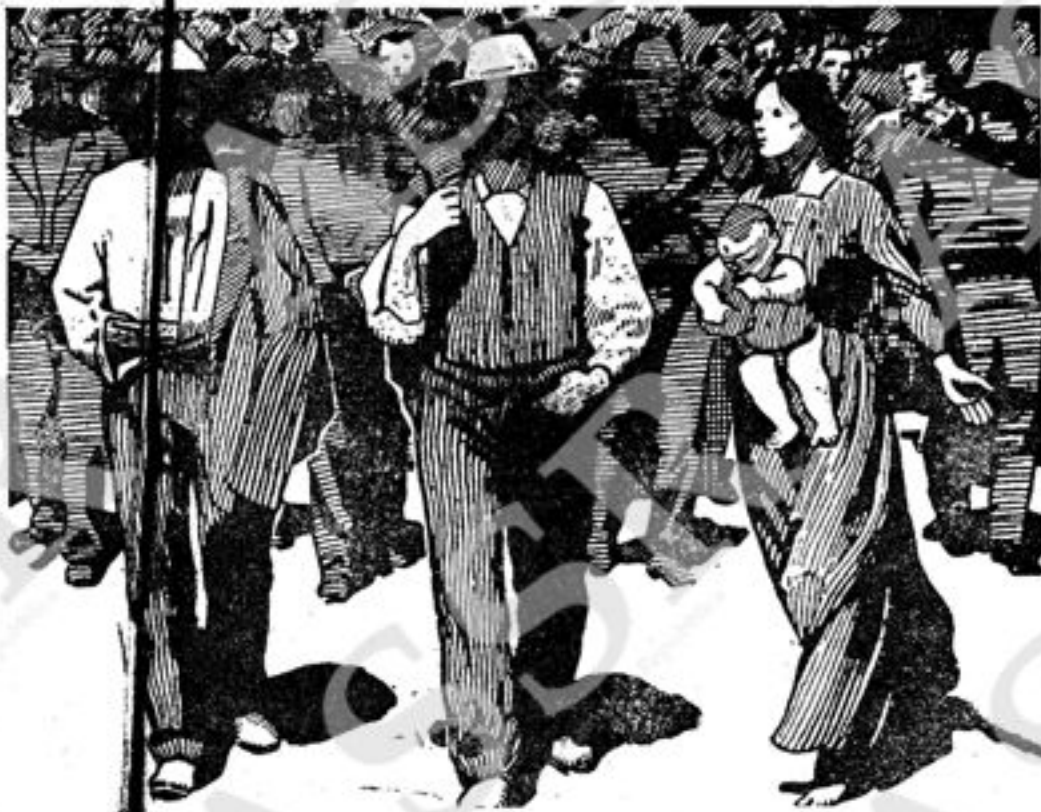
«L'esperienza delle sanzioni il diritto di presenza dei lavoratori nella direzione dello Stato. Essa è stata, come è, l'età di difficoltà e ha dato luogo a responsabilità opposizioni»

La guerra del Vietnam si prolunga e si aggrava. Gli accanimenti aerei e bombardamenti americani l'altro giorno sono avvenuti in una città dove si sono già uccisi più di 100 mila persone. I cinesi, non