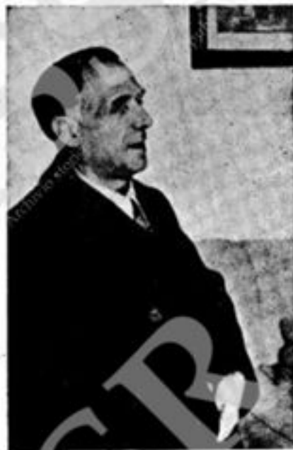
(Fine luglio 1943) Direttore del « Roma » (1 ottobre 1943) Direttore del « Risorgimento »

Tutti sanno a Napoli, e in molta parte del Mezzogiorno, come egli ha affrontato il ventennio. Ha tentato un'attività editoriale tutta personale.