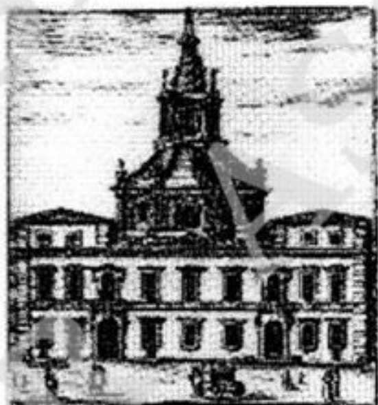
Dello Studio pubblico detto della Sapienza.