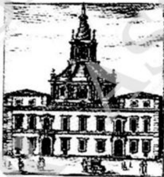
Dello Studio publico detto della Sapienza.