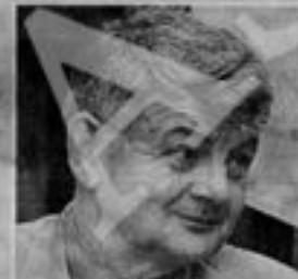
IL FEDERALISMO DI FISCHER