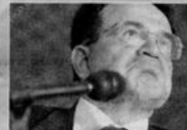
LA COMMISSIONE DI FISCHER