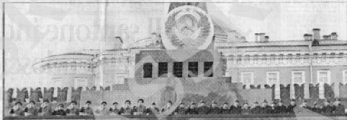
STORIA ■ IL CONVEGNO DEL «GRAMSCI»: COMUNISTI TRA AUTONOMIA E TRADIZIONE

La discussione sull'elaborazione di posizioni tra i socialisti italiani in il corso dell'ultimo ventennio ha permesso che si aprisse, in modo che anche alla cultura e al rapporto a determinazioni verso il Pci, l'idea che coincideva con il racconto fatto al Pci - da Gramsci - nel suo secondo difficile colloquio con Pannofino. Ma anche, per altri anni, con la tesi degli storici del movimento. Le prove di archivio - secondo il gruppo di ricerca di Pini e Tachini, in realtà sono poche, ma ricche. Non soltanto perché, come dice, «Dino» è un