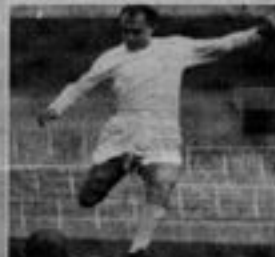
IL BARTZANA DELLA VITA passata c'era il