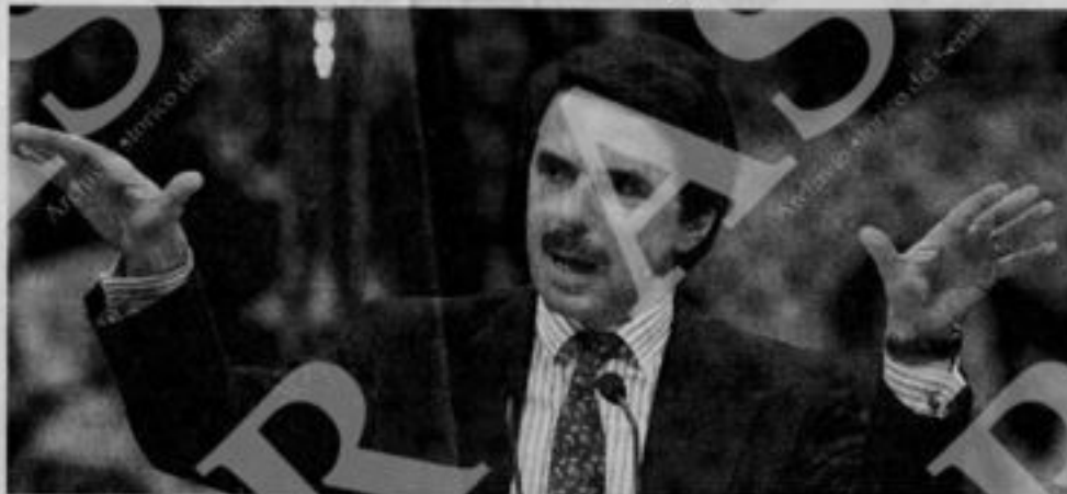
LEADER POPOLARE José María Aznar, 47 anni, avvocato, è sposato con Ana Botella, dalla quale ha avuto tre figli. È alla guida del governo di Madrid dal 1988

«La pace nei Paesi Baschi è uno degli obiettivi fondamentali di questa legislatura. Ma il cammino sarà lungo»