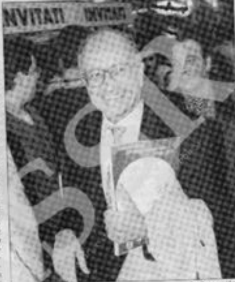
Francesco Saverio Borrelli

strati ma degli avvocati, per un errore commesso dal sarto 44 anni fa. Non l'ho mai voluta cambiare per dimostrare che siamo sullo stesso piano, che c'è un'identità di obiettivi tra avvocati e giudici che consiste nell'affermazione della legalità». Lacerazione si conclude in fretta, ma congratulazioni, abbracci e strette di mano. Ura, particolarmente calorosa con Gerardo D'Ambrosio, che per la prima volta si trova al bar da solo, per il consueto caffè delle 11, che normalmente beveva insieme al capo. Sorride a chi gli ricorda che da oggi non ha nemmeno più un capo, il primo cittadino della procura di Milano è lui, ma per scaramanzia precisa: «L'effe, facente funzioni». Si concede battute in libertà sul fatto che Borrelli è stato eletto insieme a Monteditorio scuarano le campagne per la nomina di Ciampi. «Che coincidenza, è proprio il caso di dirlo: la classe non è acqua». Poi volge il viso verso il suo ufficio, dove l'aspetto magistrata di Calliano e della Direzione nazionale antimafia. Un anno dopo D'Ambrosio conosceva anche i sostituti Francesco Groce e Paolo Ielo, all'ordine del giorno scambio di informazioni su appalti e mafia. «Mani pulite» continua, con i sostituti Borrelli. E continueranno pure i venti di tempesta sulla procura di Milano. Da Roma rientra la notizia che il pm Piercamillo Davigo sarà processato dal Csm per l'arresto ad America Oggi