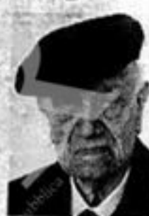
SOCIALISTA Francesco De Martino, ex segretario del Psi. Anche il vecchio leader ha gioito per la vittoria del «no»

Già, proprio quel Garavini che fu estromesso dalla segreteria di Rifondazione comunista per far posto a Fausto Bertinotti. E che tutti, ormai, davano sulla via della onorata pensione. Per non parlare di Armando Cossutta. Sulla Maginot del «no» il leader dei Comunisti italiani può riabbracciare l'amico-nemico Fausto. Due «compagni» ritrovati sotto la stessa