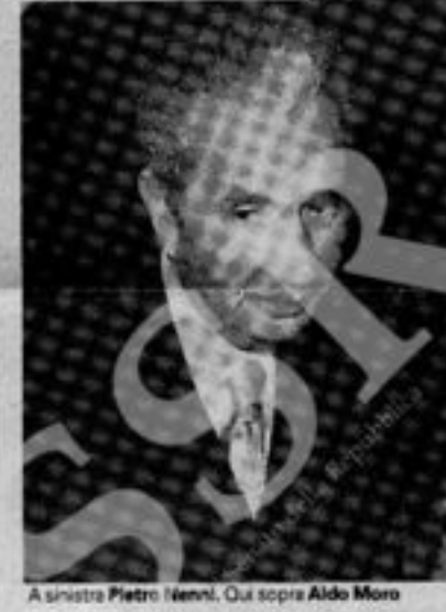
A sinistra Pietro Nenni. Qui sopra Aldo Moro

Lei ebbe allora la sensazione che qualcosa di poco chiaro, di irregolare, si fosse messo in moto?