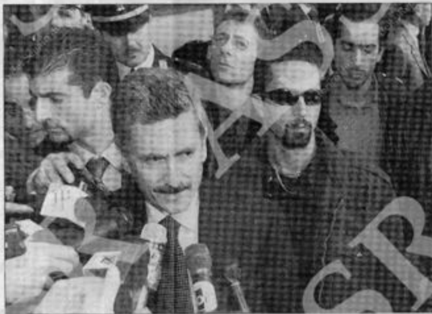
Francesco De Martino d'accordo con il capo del governo: tutti commisero errori

A gennaio la resa dei conti: «Siamo tutti d'accordo che alla fine della Finanziaria si dovrà avviare una verifica e la verifica — ne è certo il segretario del Ppi Castagnetti — non può che avere il passaggio della crisi».