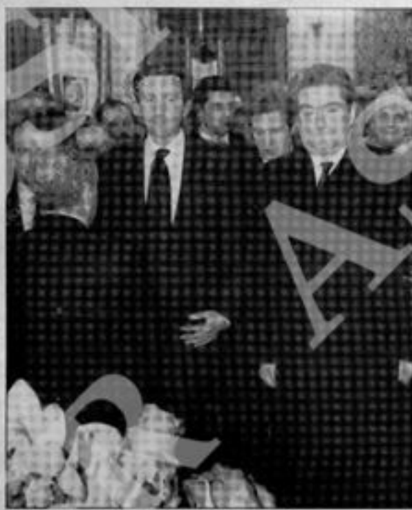
Bari, Gianfranco Fini con Sali Berisha ai funerali di Tatarella