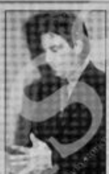
Il primo ministro britannico Tony Blair

BRUXELLES — Il premier britannico Tony Blair aveva due candidati alla presidenza della commissione Ue: l'ex presidente del consiglio italiano Romano Prodi e il primo ministro portoghese Antonio Guterres. Ma le quotazioni di Prodi e Guterres sono «fortemente in calo», secondo il Financial Times che si occupa pertanto di Downing Street a cercare nuovi candidati da sponsorizzare. Il numero uno nella classifica di Blair, Guterres, osserva il quotidiano finanziario «si è tirato fuori al summit dei leader socialisti a Vienna e ci sono crescenti incertezze sul fatto che Prodi arrivi fino in fondo» come candidato.