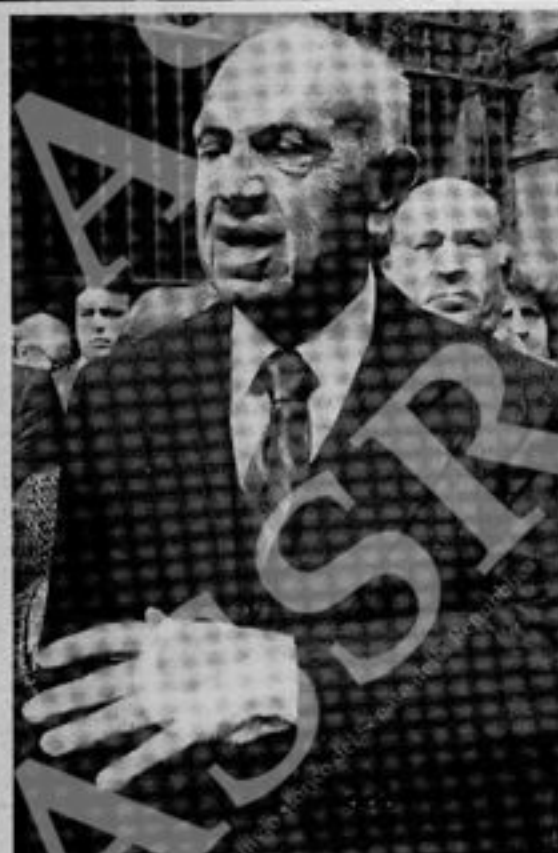
Francesco De Martino, che durante il periodo del centrosinistra fu primo segretario del Psi e poi vicepresidente del Consiglio.

De Martino "La paura soffocava il centrosinistra..."