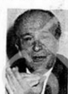
COMUNISTA Alessandro Natta, ex segretario del Pci. Domenica scorsa per la prima volta non è andato a votare

bandiera rossa, in nome del nemico comune schierato per il Sì. Tutto ciò, non va dimenticato, a pochi mesi dalla dolorosa scissione in nome della governabilità dalemiana. E che dire del professore Francesco De Martino, classe 1907, altra vecchia quercia della sinistra unita?