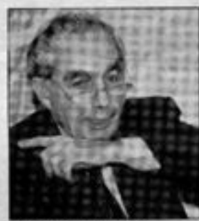
Il ministro Giuliano Amato

La nuova ipotesi di cui parla il capogruppo verde tende a semplificare il sistema di voto, soprattutto nella parte che riguarda il dieci per cento di proporzionale. Una quota che il relatore Massimo Villone vorrebbe ridurre al cinque per cento. Alla fine dovrebbero restare 577 seggi da attribuire in collegi uninominali maggioritari sulla scheda ci sarebbero solo i simboli delle coalizioni e dei partiti che non si coalizzano e il nome del candidato. I restanti 63 seggi