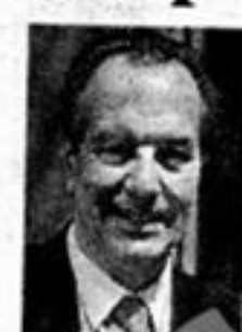
SINDACALISTA Sergio Garavini, ex segretario confederale della Cgil, ex segretario di Rifondazione comunista, prima di Bertinotti