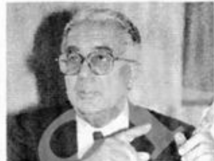
AUGURI A sinistra: Giulio Andreotti e Nicola Mancino, presidente del Senato. Sopra: Leo Valiani. A destra in alto: Armando Cossutta. A destra: Giovanni Paolo II