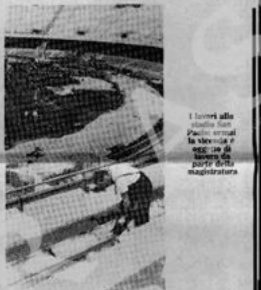
I lavori allo stadio San Paolo erano la vicenda e oggi ne è lavoro da parte della magistratura

In un paio di anni appena 12 miliardi richiesti dalla ditta Rozzi sono diventati 75. Ed i progetti sono cambiati a vista d'occhio. Via la pista d'atletica, si abbassa il manto erboso. Resta la pista d'atletica, il campo resta com'era. Un bel colpo ai preventivi l'hanno dato le cosiddette infrastrutture. Rifacciamo lo stadio, costruiamo gradinate che garantiscono una buona visibilità. E il