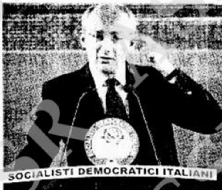
RIFORMISTA Il presidente dello Sdi, Enrico Boselli, ieri a Genova

Obiettivo: scardinare Ds e Margherita, fare la Casa dei riformisti. E il Dottor Sottile è d'accordo