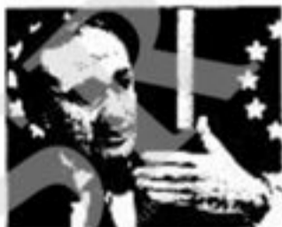
Enrico Boselli presidente dello Sdi aprirà oggi a Genova il secondo congresso del partito

«Il progetto dello Sdi è costruire la casa comune dei riformisti solidali e moderni. Quercia e Margherita non sono tutto l'Ulivo»