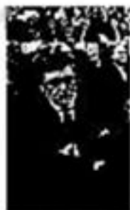
SINISTRA E SINDACATO Sergio Cofferati, leader della Cgil: il leader della principale organizzazione sindacale era ieri a Genova tra gli ospiti del congresso organizzato dallo Sdi, guidato da Enrico Boselli: il congresso si concluderà domenica