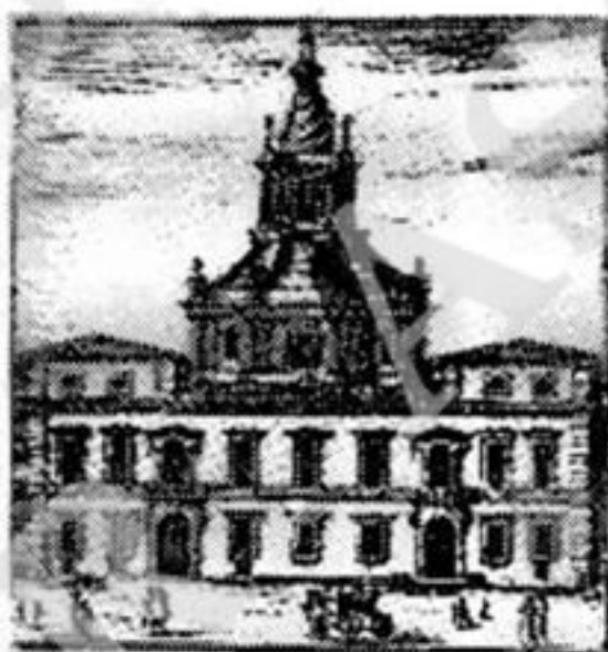
Dello Studio pubblico fatto della Sapienza.