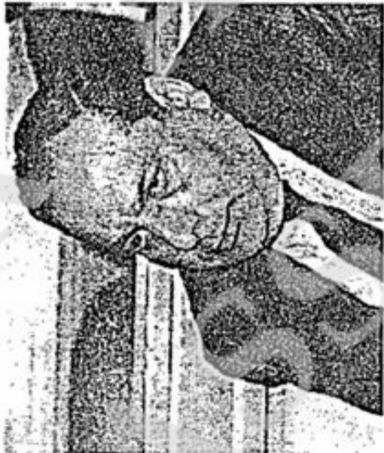
Riccardo Misasi, ministro della Pubblica Istruzione