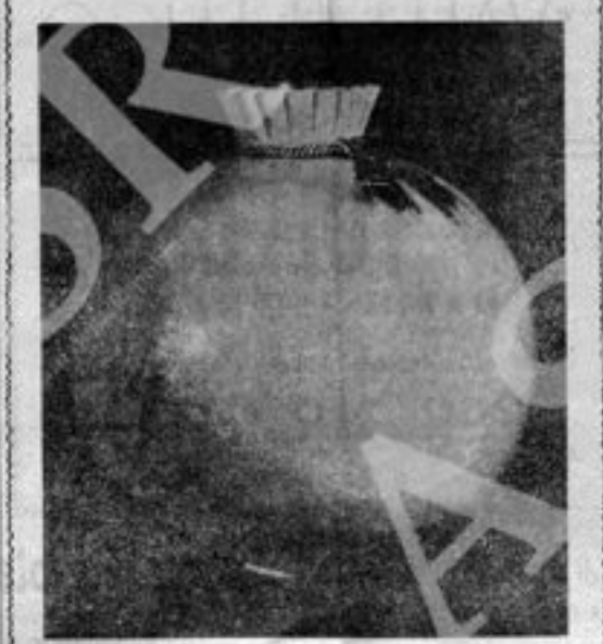
Magnifico vaso sferico decorato in grès azzurro mai con cristallizzazioni in madreperla e cordoni in blu; un tempo orgoglio del Museo internazionale delle Ceramiche di Faenza, ora distrutto.