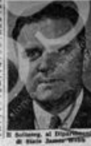
Il ministro degli Esteri britannico, Bevin...