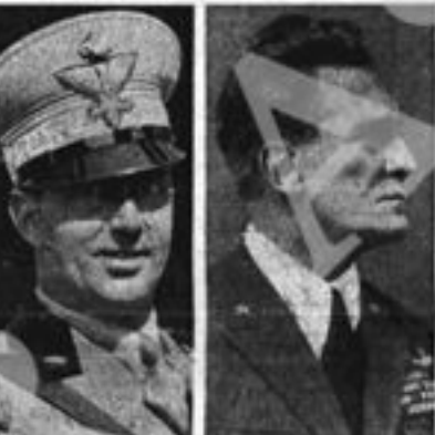
Il Principe di Piemonte e il Maresciallo Rodolfo Graziani