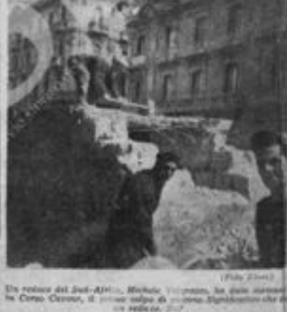
Il lavoro del Sud-Africa. In alto: il lavoro del Sud-Africa. In basso: il lavoro del Sud-Africa.