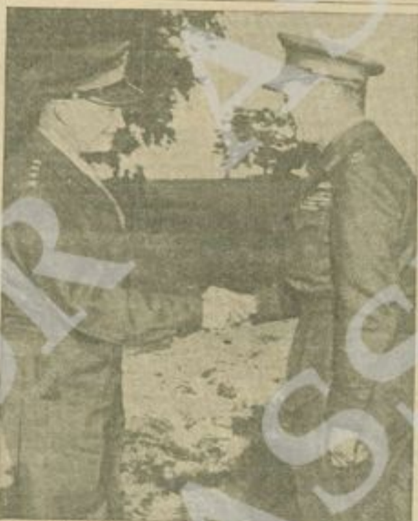
Il Re Giorgio d'Inghilterra si congratula col Gen. Eisenhower durante la sua recente visita al fronte belga.

L'odierno comunicato del Comando Supremo dell'Esercito Jugoslavo di Liberazione Nazionale e dei distaccamenti partigiani in Jugoslavia riferisce che è stata liberata l'importante città di Novi Bazar, in Serbia, centro vitale di comunicazione sulla via di scampo attraverso la quale le truppe tedesche in ritirata dalla Grecia stanno tentando di raggiungere Sarajevo. E' stata anche liberata la città di Bjelina.