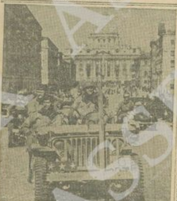
Il generale Mark W. Clark nelle vie di Roma.

La situazione all'ultima ora può così riassumersi: attraverso i colloqui, le riunioni, gli scambi di idee, si sta anche tentando di formare un Governo con la mediazione del C.L.N. Riuscirà questo ultimo tentativo? Qualcosa di speranza sussiste ancora ma è quello che vedremo al massimo entro domani.