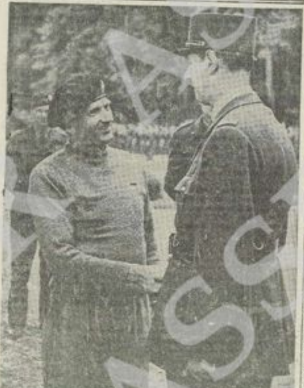
Il Maresciallo Montgomery stringe la mano al gen. De Gaulle.

Secondo altre notizie, provenienti dalla Svizzera, è preoccupante per la Germania la situazione creata con la diserzione dal lavoro degli operai stranieri. Un dispaccio, pervenuto alla Tribune de Genève, riferisce che molti lavoratori stranieri, utilizzati nelle fabbriche o nelle fattorie, sono fuggiti e si nascondono. I circoli ufficiali berlinesi ammettono che 50.000 di essi si sono dati alla macchia; numero probabilmente inferiore alla realtà, dato che molti agricoltori non hanno denunciato lo scomparsa dei loro dipendenti. Tali diserzioni, sempre secondo la Tribune de Genève, si sono verificate specialmente nella Germania occidentale, dove molti lavoratori si sarebbero rifugiati nella Foresta Nera.