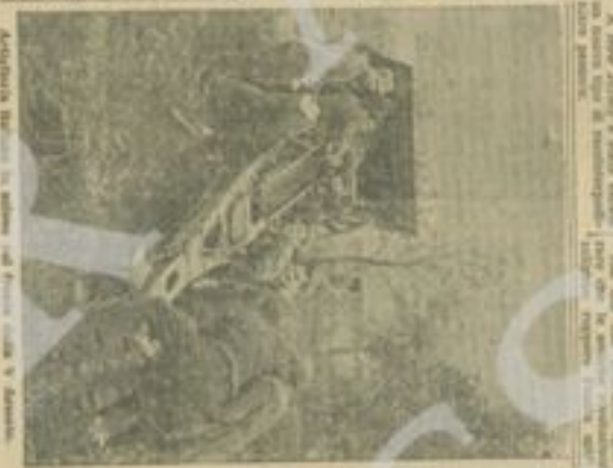
Architettura italiana in stile neoclassico, Bari, 1913.

Maharishi ed i suoi amici hanno emesso una pastorale ai fedeli, in cui hanno esortato i fedeli a sostenere la guerra con coraggio e fede. La pastorale ha sottolineato l'importanza di rimanere uniti e di sostenere le forze alleate.