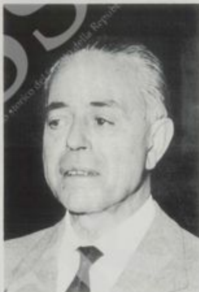
His Excellency GAETANO MARTINO Chairman of the Italian Delegation to the XVth General Assembly of the United Nations

Dr. Martino was Chairman of the Italian Delegation to the Conference on Disarmament, and is at present Chairman of the Italian Delegation to the XVth General Assembly of the United Nations.