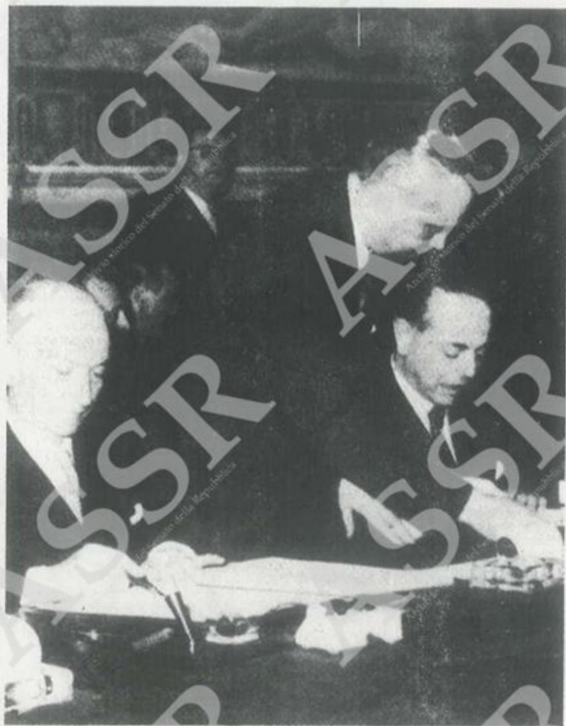
Roma, 25 marzo 1957: Gaetano Martino (a destra) e Antonio Segni firmano il trattato che istituisce la Comunità Economica Europea.