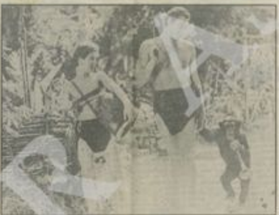
Una di Tarzan, in bianco, l'eroe della giungla Johnny Weissmuller.

Di Tarzan il cinema americano ne ha tratti tutti e uno protagonista del Tarzan Alvaro è stato di eremita, perché aveva, ancora, uguali pericoli, come quello di essere mangiato dai suoi nemici. In una avventura che lo porta a scoprire il mistero di un'isola misteriosa, il film è un omaggio a un'epoca di eroi. Questo è un film che ha fatto parlare di sé in tutto il mondo. È un film che ha fatto parlare di sé in tutto il mondo. È un film che ha fatto parlare di sé in tutto il mondo.