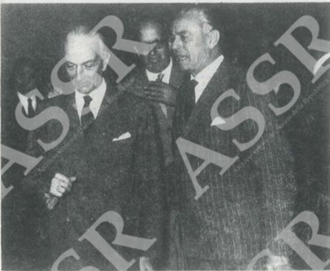
Febbraio 1957: il ministro degli Esteri Gaetano Martino insieme al presidente del Consiglio Antonio Segni dopo una missione preparatoria per la firma del Trattato di Roma.