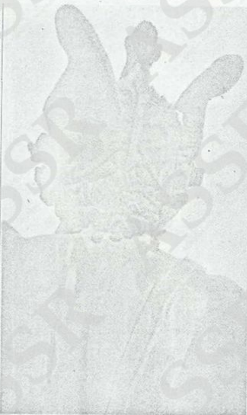
Benvenuto Cellini: un particolare del « Perseo »

Per lui è tempo ormai di mutare ambiente: (anche il papa è cambiato, è Paolo III Farnese, e suo nipote Pier Luigi ha Benvenuto in odio). Nel '40 Cellini parte per la Francia con due lavoranti. Il re Francesco I lo accoglie da par suo, gli assegna una bella pensione e gli commette numerosi lavori. Cellini sfoggia il proprio ingegno in molte « minuterie » (tra le altre, una famosa saliera d'oro detta del Mare e della Terra), scopre al tempo stesso una recondita passione per la scultura e lavora ad alcuni « colossi ». Purtroppo, anche alla corte di Francia, le male lingue tramano contro di lui. Nell'agosto 1545 Benvenuto è di nuovo a Firenze: vuol fare vedere ai suoi concittadini quanto vale. Lavora d'impeto e bene: nella primavera del '54 ha la