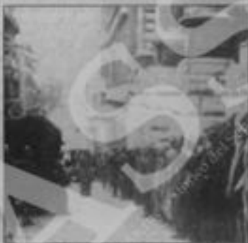
A sinistra, alcuni dei civili italiani presi dai nazisti per la rappresaglia. A destra, un militare tedesco controlla via Rasella

Il verdetto smentisce la tesi "revisionista" che ha tentato di screditare l'azione condotta dai partigiani dei Gap romani