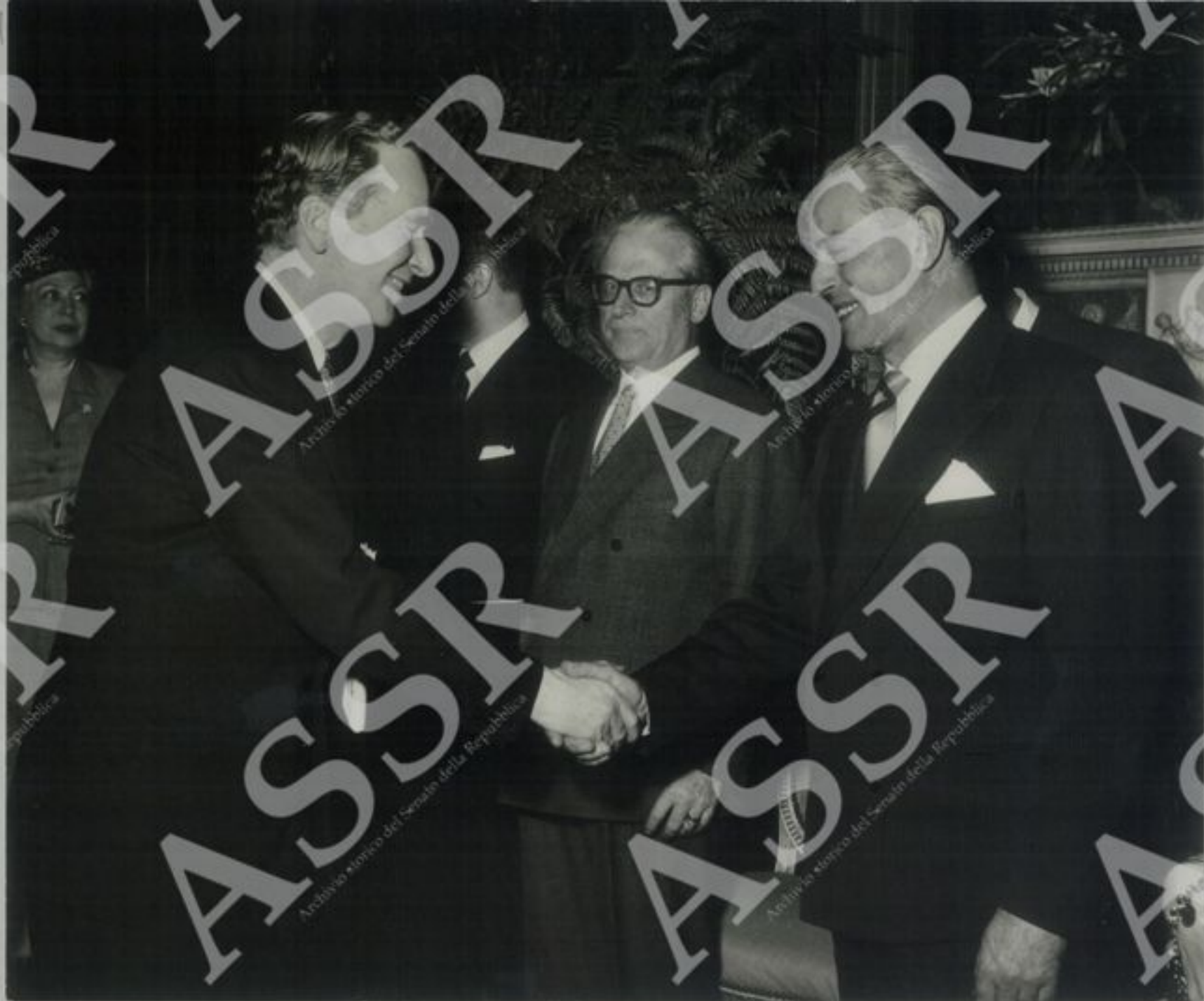
L'Ambasciatore Sir Pierson Dixon (Regno Unito)