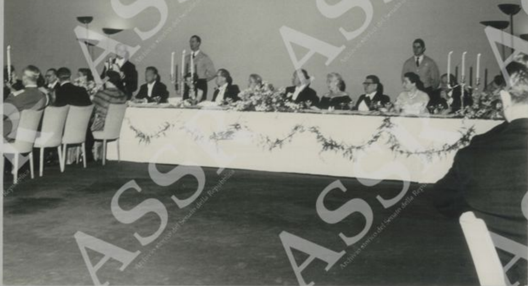
Ricevimento ufficiale alle N.U. Il Signor Presidente della Repubblica risponde al brindisi del Segretario Generale.