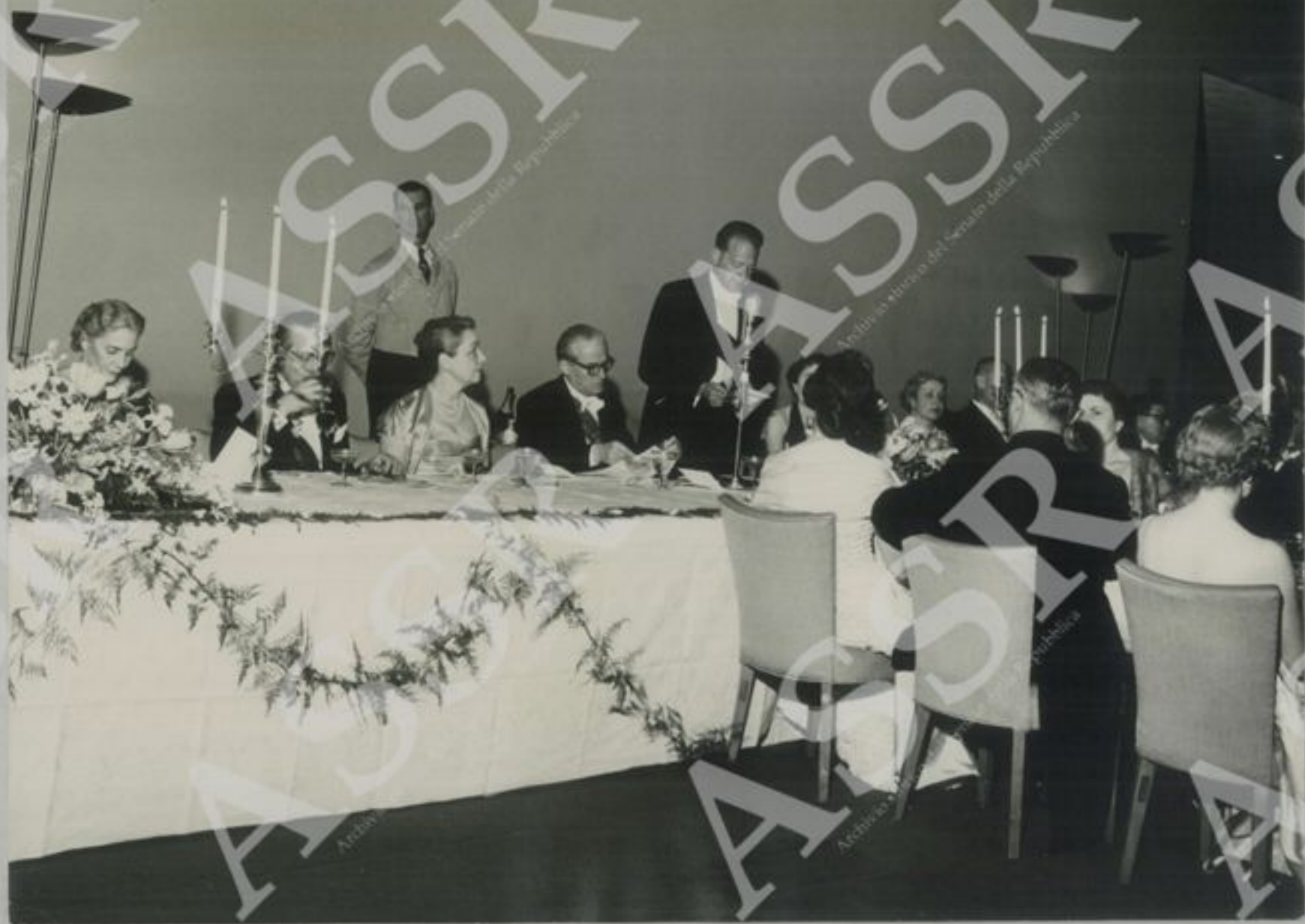
Ricevimento offerto dal Segretario Generale delle N.U. Il Signor Hammarskjöld porge il benvenuto agli ospiti italiani.