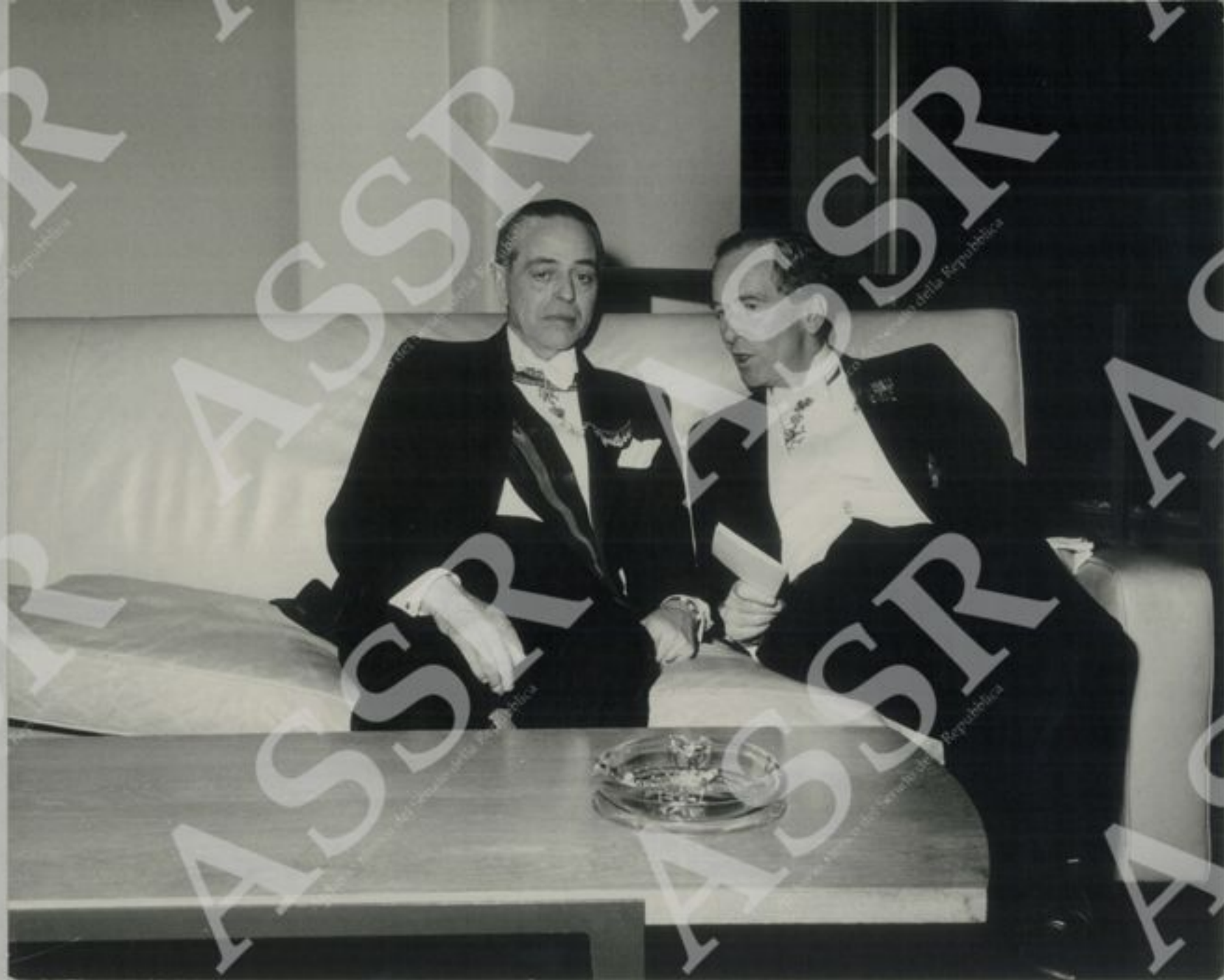
Ricevimento ufficiale alle N.U. - L'Ambasciatore Sir Pierson Dixon (Regno Unito)