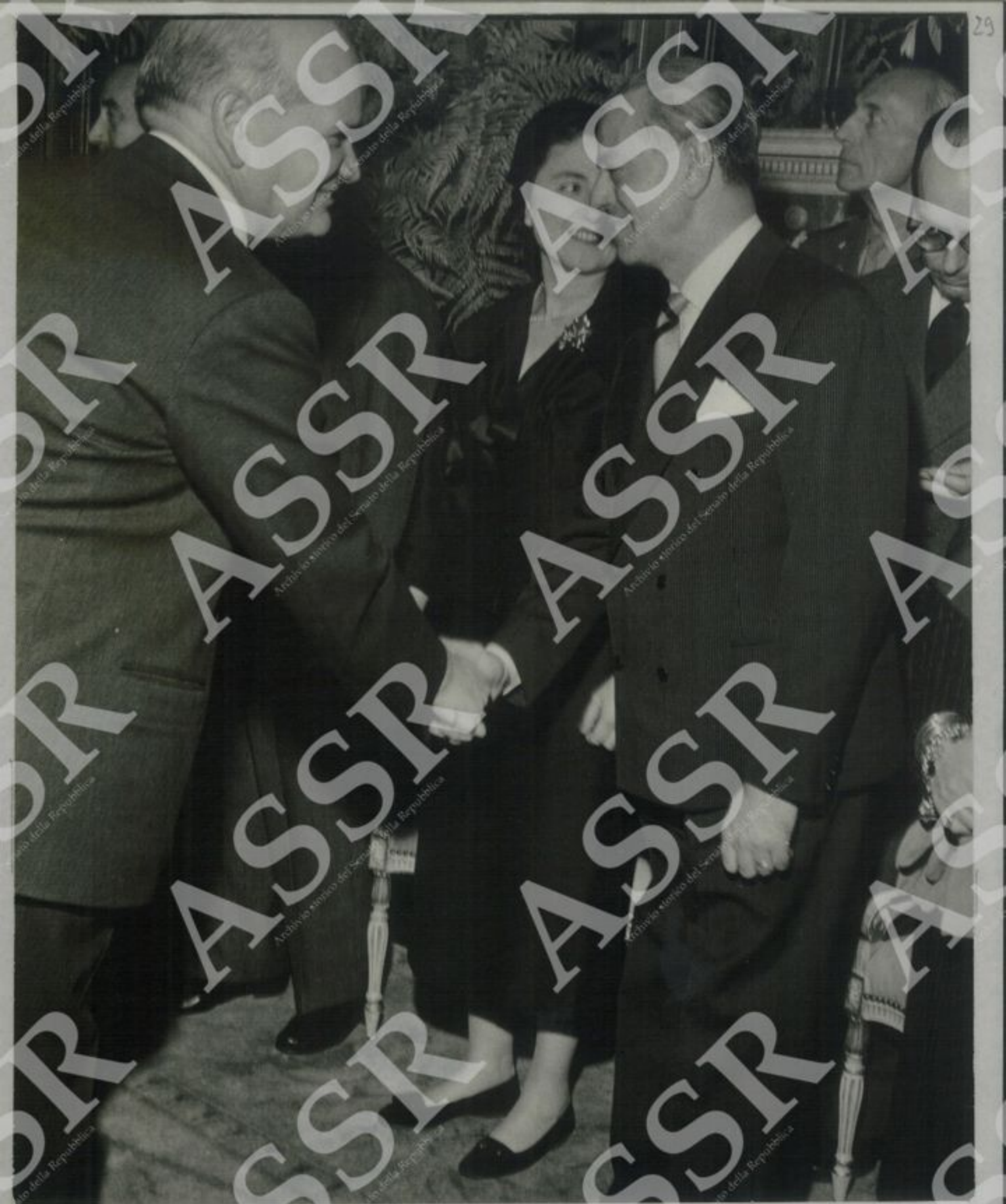
L'Ambasciatore Omar Loutfi (Egitto)