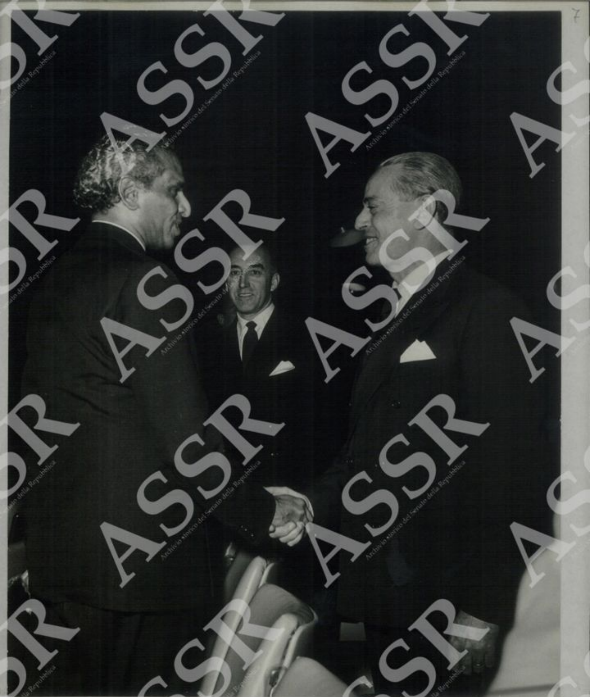
Visita al Consiglio di Tutela - V.K.Krishna Menon, M.P., Rappresentante dell'India.