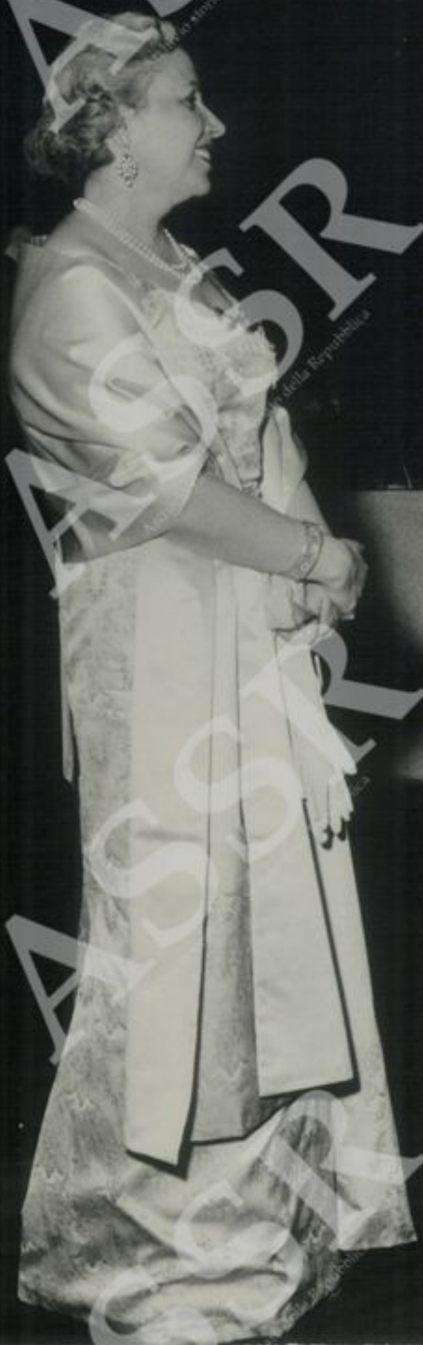
Ricevimento ufficiale alle N.U. Il Segretario Generale delle N.U.