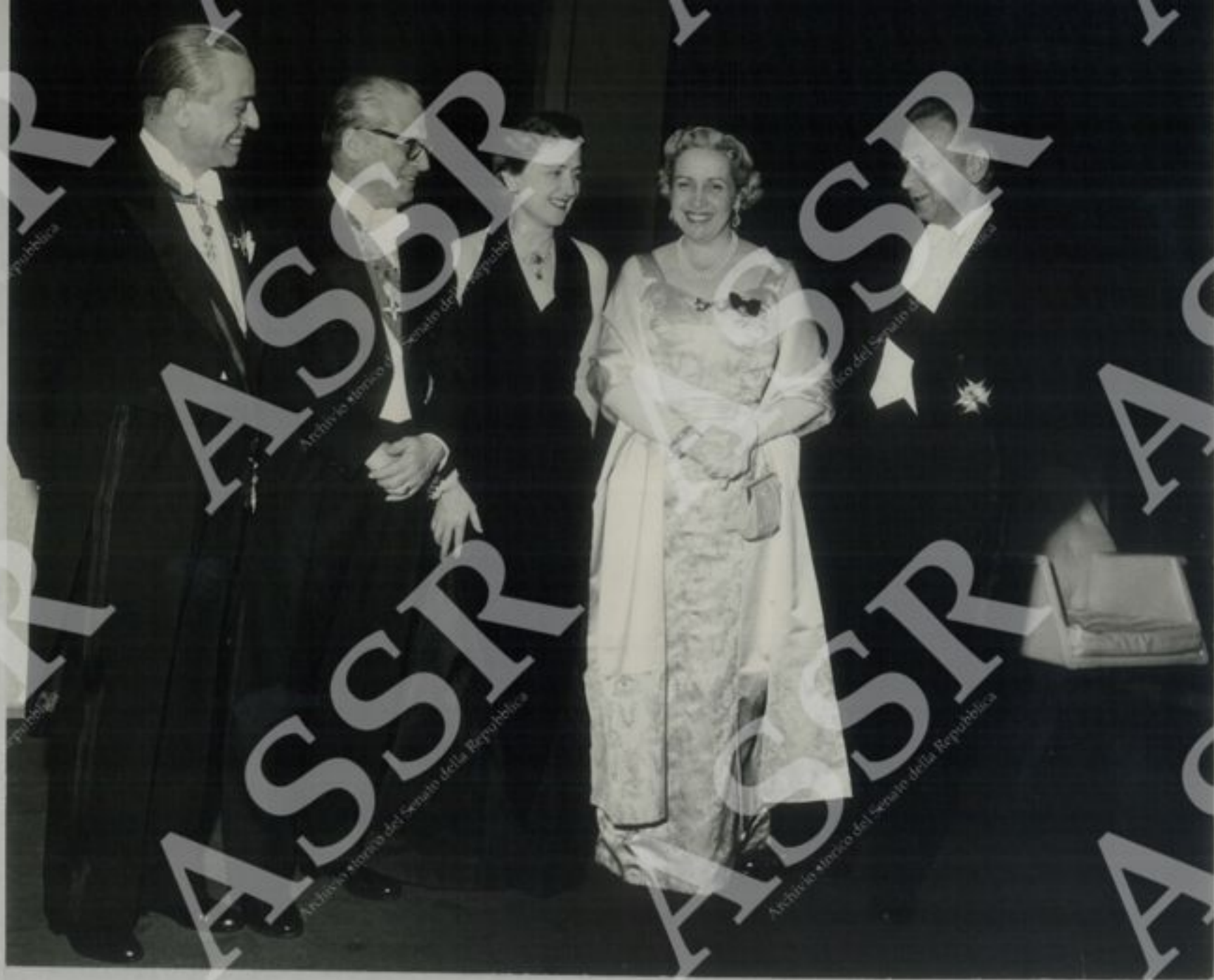
Ricevimento ufficiale alle N.U.