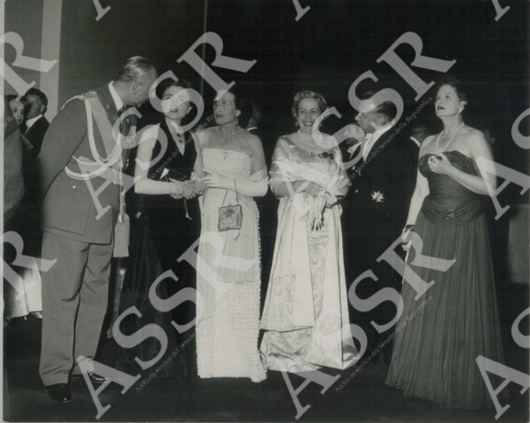
Ricevimento ufficiale alle N.U.