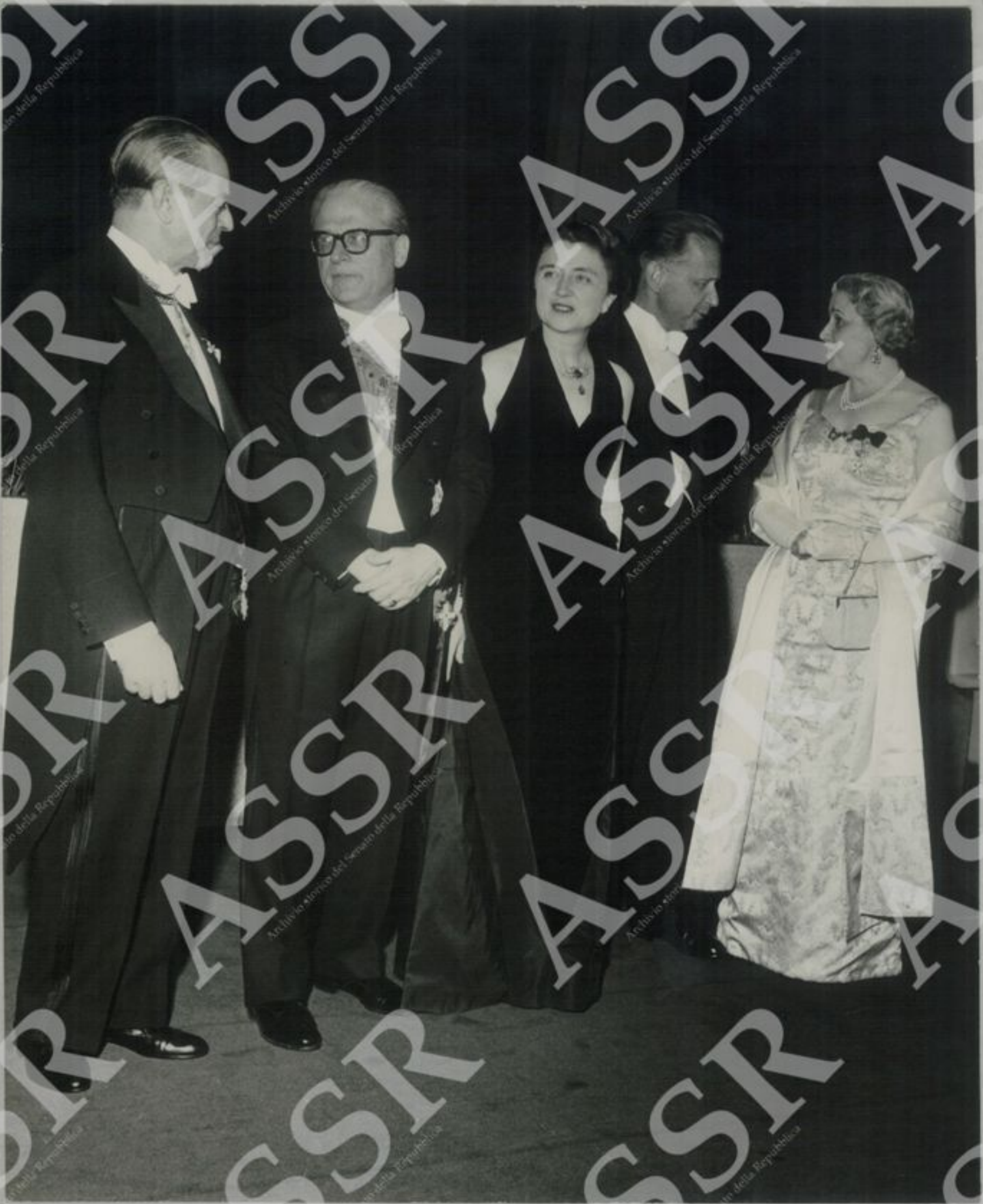
Ricevimento ufficiale alle N.U.