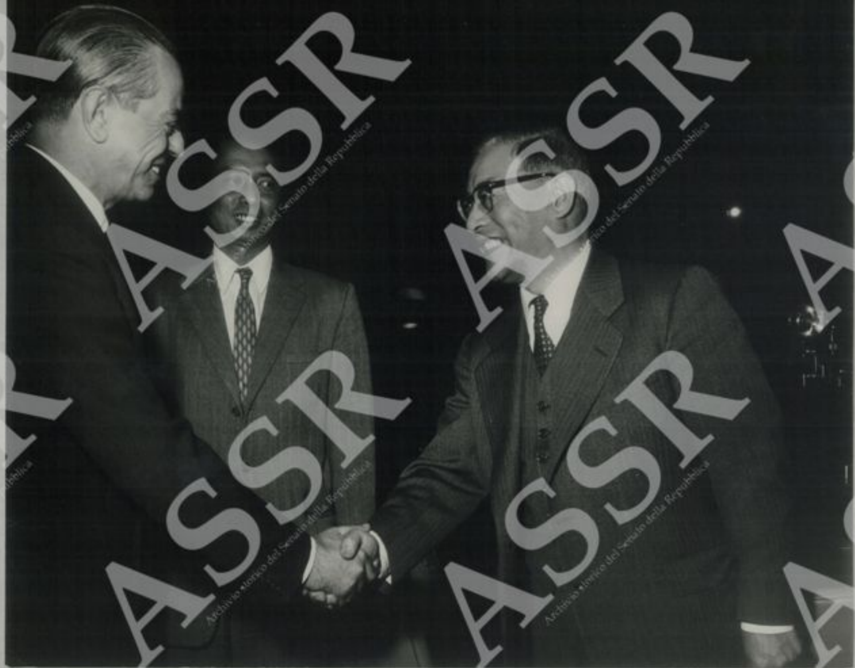
Visita al Consiglio di Tutela - L'Ambasciatore U. Win (Birmania) e l'Ambasciatore Shih-Shun Liu (Cina)