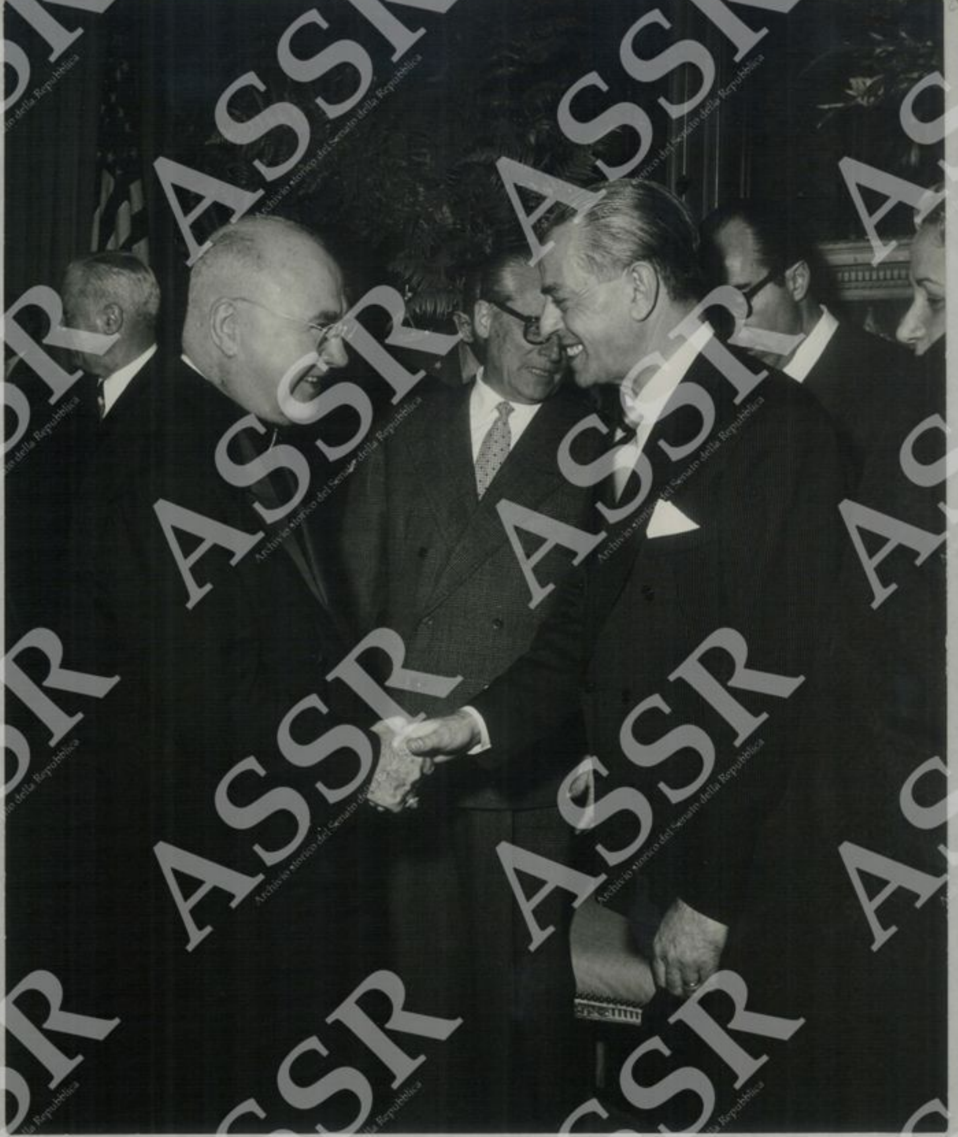
Sua Eminenza il Cardinale Spellman