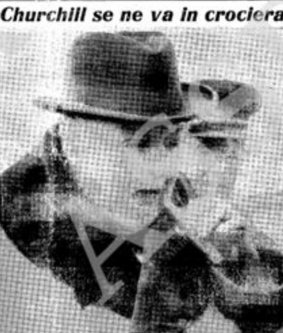
La stoffa è partita in aereo per Gibilterra, dove si imbarcherà sul pontile di guerra per una crociera sul Mar del Sarallo. Churchill ha deciso il viaggio, annodato la maglietta a tollera le spalline, perché la signora sia molto meglio.

Churchill se ne va in crociera. Roma, 8 marzo. (R. A.) Churchill se ne va in crociera.