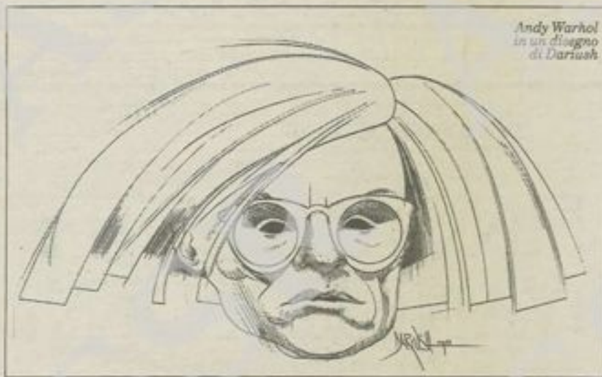
Andy Warhol in un disegno di Dartush

bella di Firenze è MacDonald. A Pechino e a Mosca non c'è ancora niente di bello». Peccato che Warhol non sia vissuto abbastanza per vedere i Sovietici mentre fanno la coda al nuovissimo MacDonald dell'era gorbacioviana, constatando, in qualche modo, la vittoria della sua filosofia.