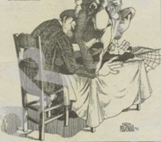
J. D. Salinger in un disegno di Madonna

amici e i conoscenti: s'era ritirato in campagna, vedeva pochissima gente, dettava norme severissime agli editori, proibiva la pubblicazione delle sue foto e, naturalmente, non faceva che stuzzicare la curiosità.