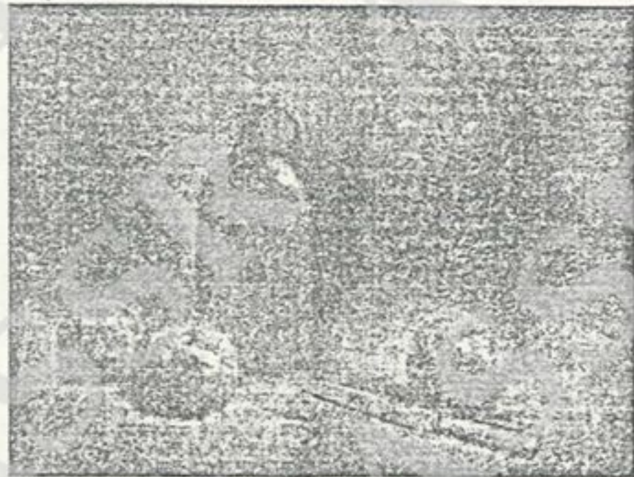
CARLO CARRA' - Natura morta