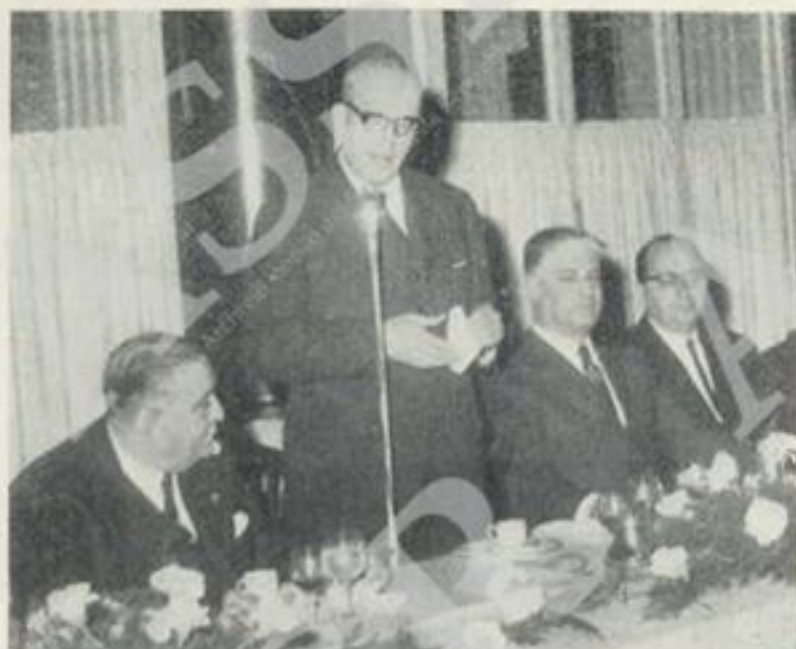
I tre Vicepresidenti e il Segretario