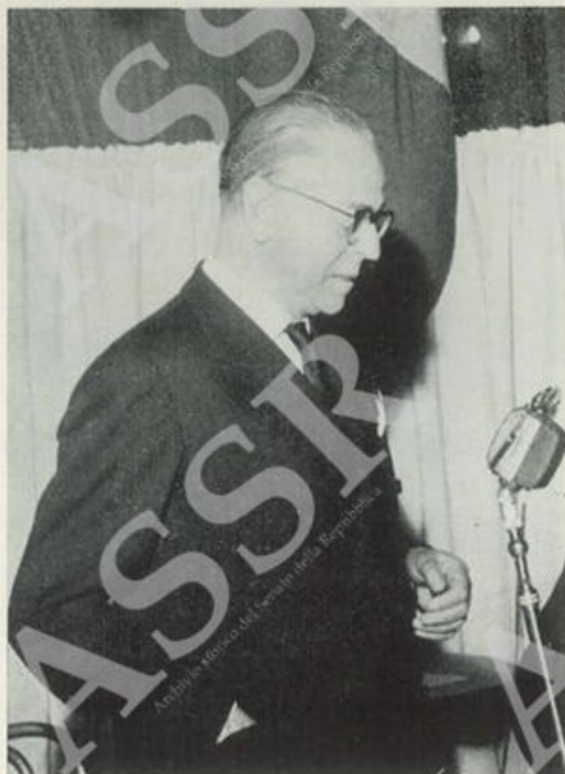
S. E. On. Gaetano Martino

Certo, il trasferimento dal piano economico al piano politico del processo unitario deve avvenire per gradi, sino ad