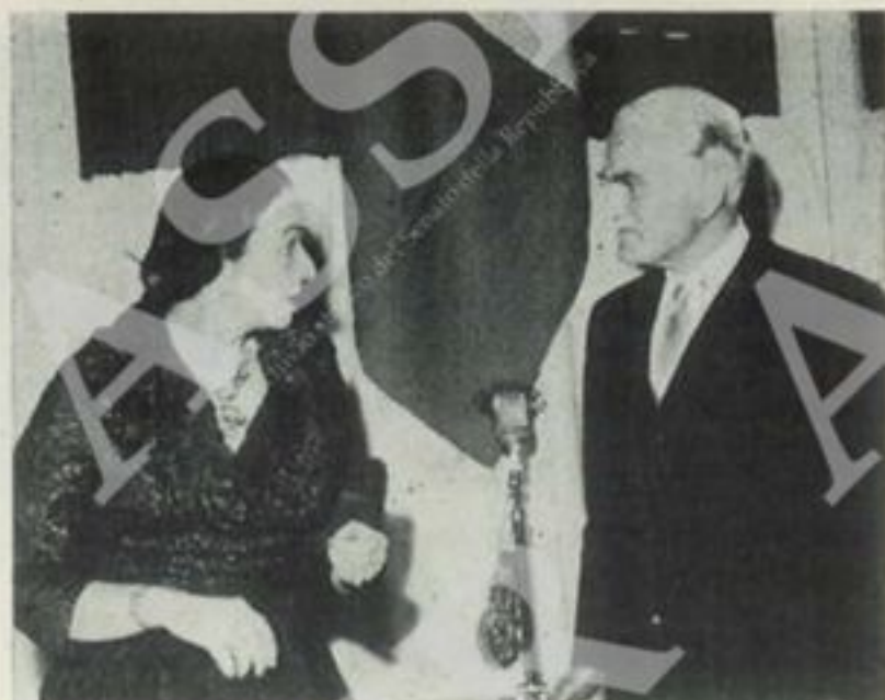
L'Ambasciatore Pietromarchi con la gentile signora

Gli stati nazionali non sono in grado isolatamente di far fronte ai problemi dell'ora: solo gli stati continentali, solo i grandi raggruppamenti di popoli possono farlo.