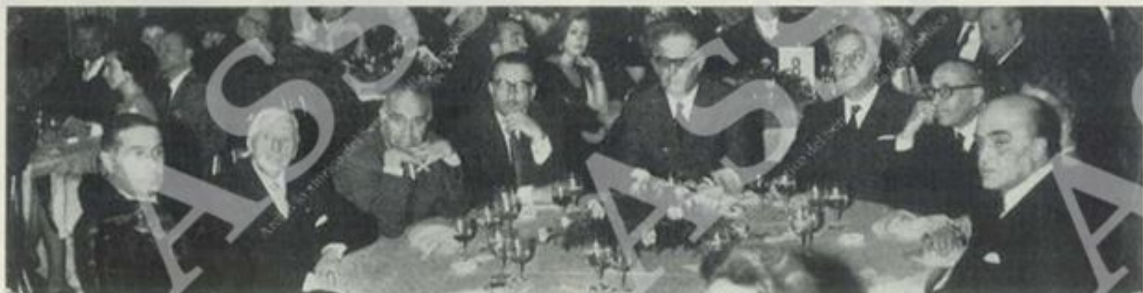
Convegno dei Fondatori

solo con la partecipazione dell'anima popolare la si può ricostruire. Finché il Parlamento Europeo non sarà eletto a suffragio universale e diretto, ma sarà nominato, come attualmente dai Parlamenti dei Paesi membri della Comunità, l'unico legame effettivo e consistente tra l'anima popolare e le istituzioni comunitarie dell'Europa, è rappresentato dai Parlamenti nazionali. I Parlamenti nazionali, nel loro insieme, esprimono veramente la volontà collettiva dei Paesi della Comunità. Il fatto che si siano riuniti i Presidenti di questi Parlamenti insieme col Presidente del Parlamento Europeo ed abbiano riaffermato la fede comune nell'Europa, è veramente confortante, e perché ci dice che per queste vie si può veramente creare quella coscienza popolare, unitaria degli Europei indispensabile per costruire politicamente l'Europa, e perché in questo momento di bufera, quale è quello attuale, sorge questa nuova speranza.