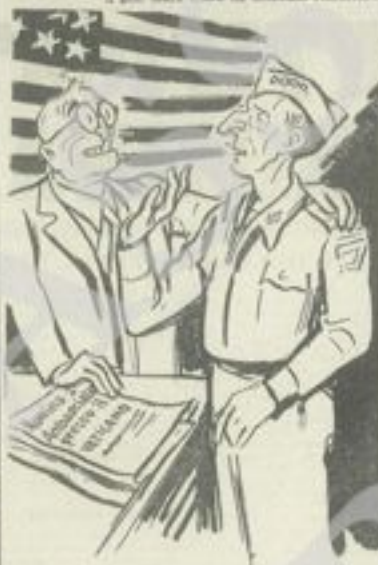
TEHRAN. — Il generale Clark, nella sua veste di ambasciatore, ha rifiutato l'incarico di ambasciatore presso il Vaticano.

«Nominato Ambasciatore presso il Vaticano, il gen. Mark Clark ha declinato l'incarico»