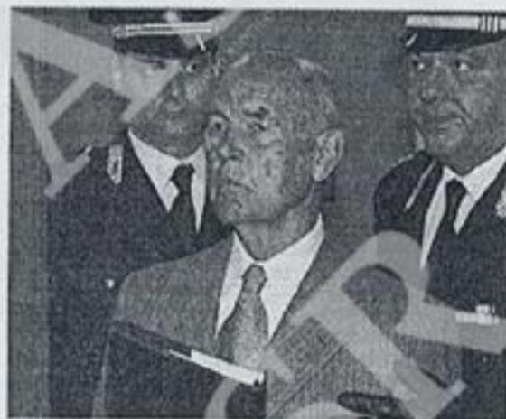
Erich Priebke al processo per la strage delle Ardeatine

ROMA — L'ex capitano delle Ss Erich Priebke e l'ex maggiore Karl Hass «si trovarono ad agire in completa adesione all'ordine ricevuto e senza subire alcuna coartazione della volontà». È il passaggio con il quale, nella motivazione di 180 pagine, la Corte militare d'Appello di Roma giustifica la condanna all'ergastolo per i due ex nazisti per l'eccidio delle Fosse Ardeatine. I giudici hanno poi sottolineato come, a dispetto della loro avanzatissima età, per Priebke ed Hass gli anni siano «passati inutilmente, perché la loro vita appare la cinica conferma della ineguagliabile malvagità esibita nella commissione del reato. Gli anni, lungi dal poter essere invocati ai fini di una attenuazione della loro colpa, rappresentano la riprova della meritevolezza