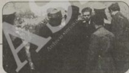
Nelle immagini a sinistra e in alto, alcuni momenti del rastrellamento dopo l'attentato di via Rasella

«Credo che ci sia un rischio di una speculazione da parte di chi cerca di riaggiornare questa storia. A molti, non è andata giù l'idea che Roma sia diventata la capitale europea della lotta di liberazione».