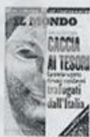
Il Mondo in edicola

MILANO — Era la collezione principe del Metropolitan Museum of Art, il tesoro di cui i suoi dirigenti andavano più orgogliosi: ma quei 15 splendidi manufatti d'argento, risalenti al terzo secolo avanti Cristo, erano stati rubati in Sicilia. È solo una delle vicende ricostruite nell'ultimo numero del «Mondo», oggi in edicola: il settimanale pubblica una grande inchiesta sui traffici d'arte, annunciata in copertina con il titolo