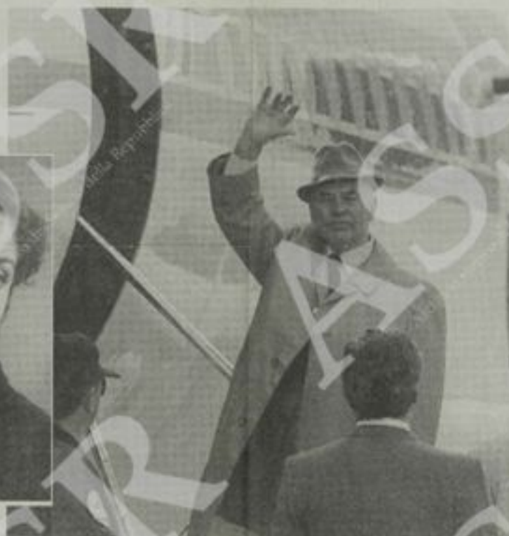
Erich Priebke alla partenza dall'aeroporto di Bariloche