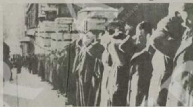
Un rastrellamento in una strada di Roma dopo l'attentato di via Rasella il 23 marzo 1944

C L'ORDINE DI KAPPLER Il comandante della Gestapo, maggiore Robert Kappler, fece appoggiare sulla foto alcuni prigionieri, alcuni comuni ai loro parenti. Man mano venivano occupati, si vedeva il carcere di Roma, il semplice Priebke.