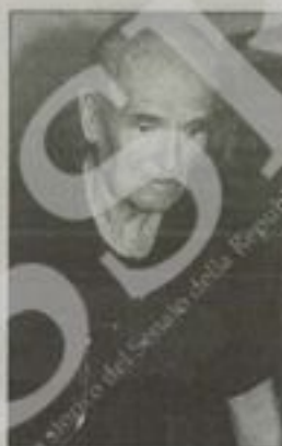
Karl Haas. Sopra, Erich Priebke

Non solo. Altre prove della responsabilità operativa e decisionale dell'ex capitano delle Ss, so-