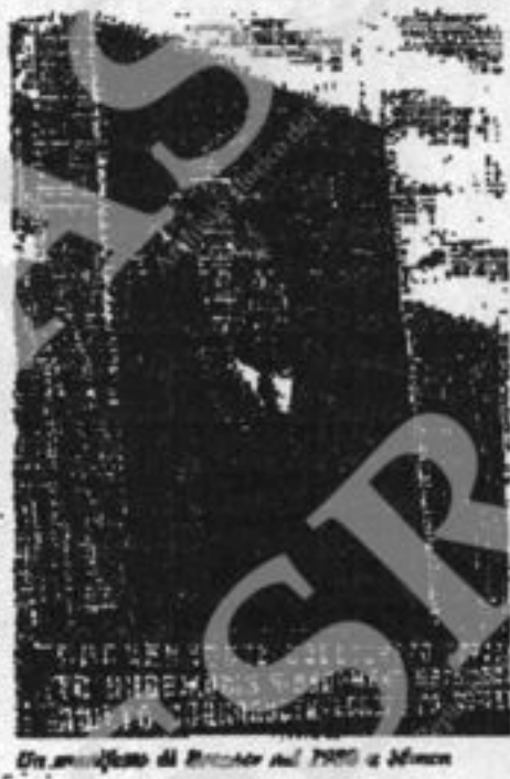
Un momento di protesta nel 1970 a Milano

come per l'insurrezione l'insurrezione spesso si a verso un avversario ma subito come a però il fatto che cote democratiche, pur to le poche e le in- Bakovskij, si è tutto scoperto, ap- cambiano, il «civota- » che si dichiarano quello del momento. Vittorio Strada