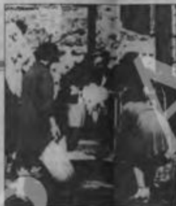
Prima volta che un uomo lavora in biblioteca nelle foreste pubbliche

Bottigaglia, la cui tentazione era di mettere in difficoltà i nostri compagni, si cominciò a sparare il 21 novembre. Le armi del generale Carboni, due zamboni, furono consegnate ai comunisti, tra cui Longo e Tonibadri, con l'ordine di distribuirle ai romani affinché la città si potesse difendere. Sabito dopo (3) settembre, era stato fatto sapere un treno di