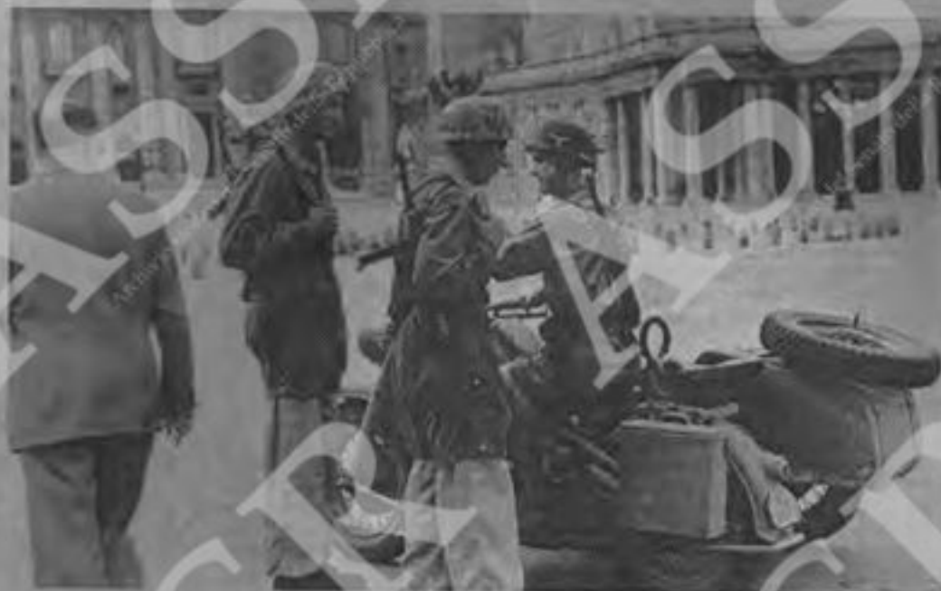
Soldati tedeschi a piazza San Pietro nel settembre del 1943

Certo, non va sempre così: spesso s'incontrano anche i provocatori e gli squadristi, quasi sempre guidati da responsabili politici di qualche ben noto partito di destra, che ha tutto da perdere in un dibattito sereno. Ma questa è la realtà che in genere si riscontra, e non solo nelle scuole, nella memoria storica di gran parte della gente. Perfino nei nostri partiti di sinistra, perfino nel nostro vecchio Pci, e non solo sugli episodi che sono stati emblematici obiettivi della mistifi-