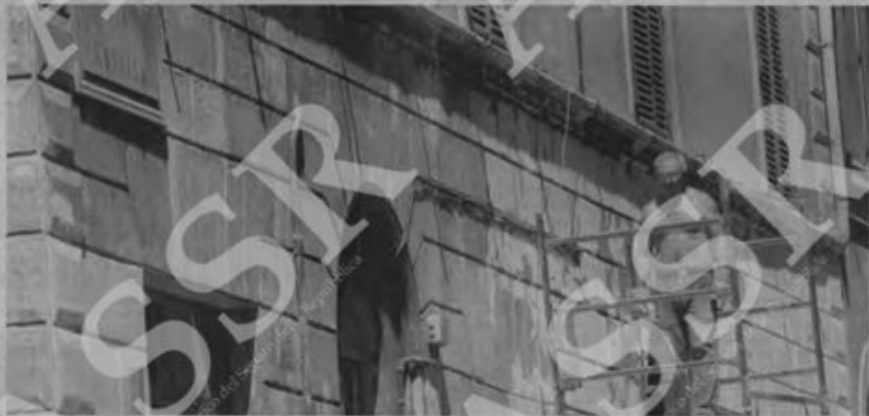
Il punto nel quale fu colpita la compagnia di partigiani il 23 marzo 1944 contro la battaglione nazista Breton in via Rasella a Roma

Il palazzo Trossi che per primo fu ucciso dalla scoppia e dagli spari dei militari tedeschi è stato «ripulito» dal cemento, lo spazio di fronte, inteso, fermato i lavori. Quell'angolo di strada era una «zona prima», si ferme come una zona morta. Ma così bianco, così ripulito, il sole che ormai pareva su una