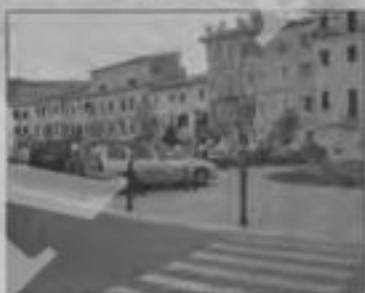
Piazza Martin della Libertà a Poggio Mirto

Il presidente dei difensori tributari: «E' una situazione penalizzante per la categoria»