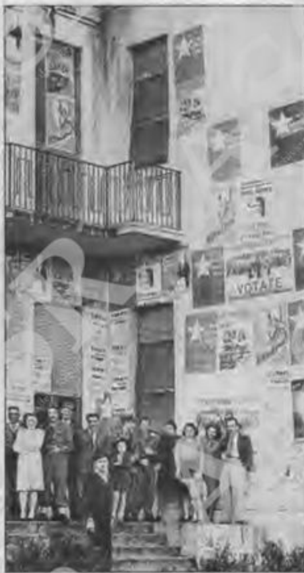
Si riprende a votare.

Per offrire un contributo alla interpretazione del ruolo che ebbe quella stagione politica, non solo nelle circostanze della transizione ma in tutto il cinquantennio della democrazia repubblicana, procederemo ad una rivisitazione puntuale dei cinque congressi che si svolsero tra la fine di dicembre del 1945 e la fine di aprir-