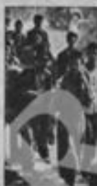
Tutti a casa

APRILE '44 I muscoli del quartiere deportati in Germania