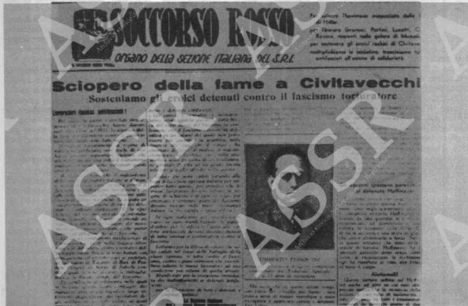
«Una vittoria del proletariato»: così l'Unità definisce il patto di unità d'azione firmato a Parigi il 17 agosto 1934 tra il Pcd'I e il Psi (foto sopra). Sotto: la prima pagina del Soccorso Rosso, l'organo della grande organizzazione proletaria che raccoglie, a prezzo di inauditi sacrifici, le sottoscrizioni

Una vittoria del proletariato. Il patto d'accordo per l'azione immediata concluso fra il Partito Comunista d'Italia e il Partito Socialista Italiano, è un documento storico, che segna un punto di svolta nella lotta del proletariato italiano.