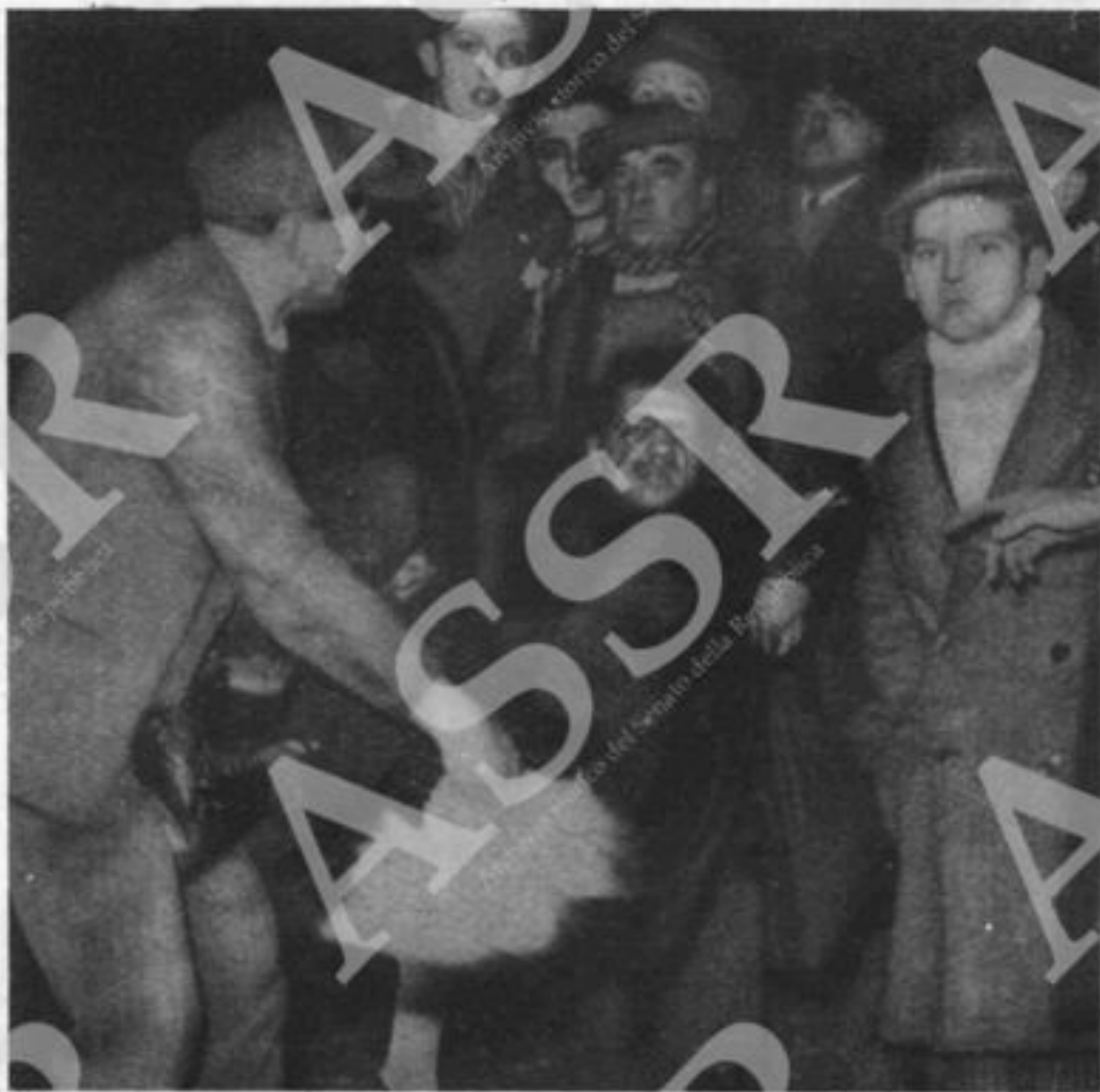
Parigi, 6 febbraio 1934. Gli ex-combattenti si avviacono verso palazzo Borbone (foto sopra) urlando: « Viva la dittatura nazionale! ». Dietro le loro medaglie si nascondono le squadre armate dei movimenti fascisti, che vogliono tentare il colpo di Stato. Contemporaneamente, infatti, un gruppo di deputati